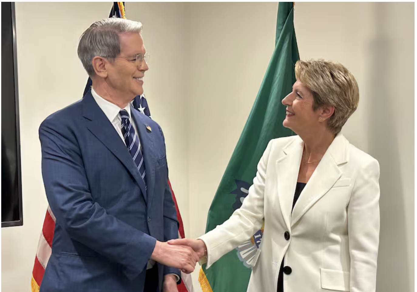
Скотт Бессент и Карин Келлер-Суттер.

Автор: Заррина Салимова, Берн , 28.04.2025.