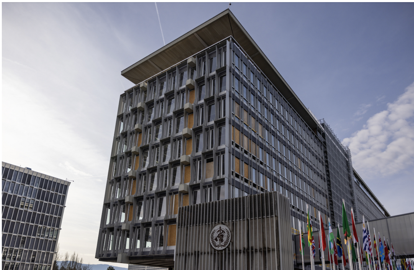
Штаб-квартира ВОЗ в Женеве

Автор: Заррина Салимова, Женева , 23.04.2025.