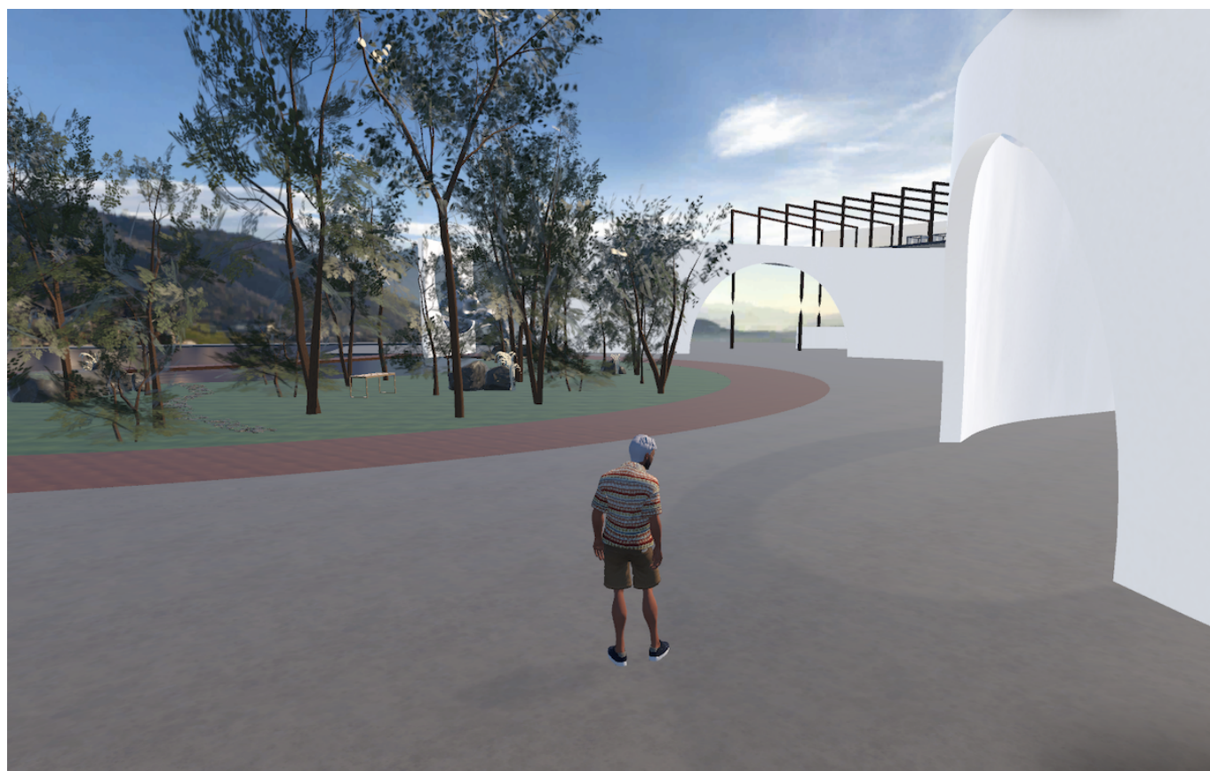
Прогулка по метаверсии Цуга.

Прототип метавселенной Цуга доступен на платформе Spatial.io . Открыв ссылку, вы, вместе с другими пользователями, оказываетесь у входа в виртуальный культурный центр. С помощью клавиш на клавиатуре ваш аватар может передвигаться по пространству (ходить, бегать, прыгать и даже делать сальто), управлять камерой, взаимодействовать с другими пользователями. Мы побывали на нескольких этажах импровизированной цугской галереи, случайно упали в фонтан, покатались на футуристичном лифте, представляющем собой подвешенную в воздухе открытую биоморфную платформу, полюбовались выставленными картинами, наведя на них зум, потом заглянули в пустой кинотеатр, где на экране завис какой-то стоп-кадр, побывали в конференц-зале, посидели на террасе кафе с видом на озеро и горы, освещенные закатными лучами солнца, помахали рукой и послали ответное сердечко другим коммуникабельным пользователям. В общем, неплохо провели время. Исследовать метавселенную Цуга можно не только через браузер своего компьютера, но и с помощью приложения или очков виртуальной реальности.