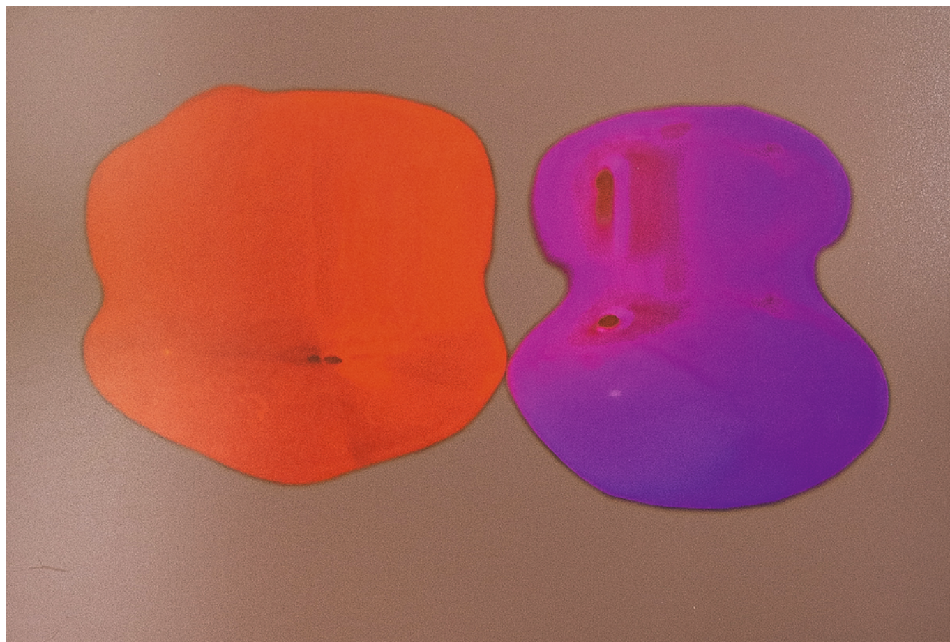
Одна из картин, выставленных в метаверсии Цуга

коллекция произведений искусства, включая редко выставляемые художественные объекты, находящиеся на складе. Метагалерея, безусловно, не заменит выставку в реальном мире, но платформа может заинтересовать искусством аудиторию, которая обычно не посещает музеи, например, подросткам, знакомым с Playstation, наверняка понравится изучать пространство в игровой форме.