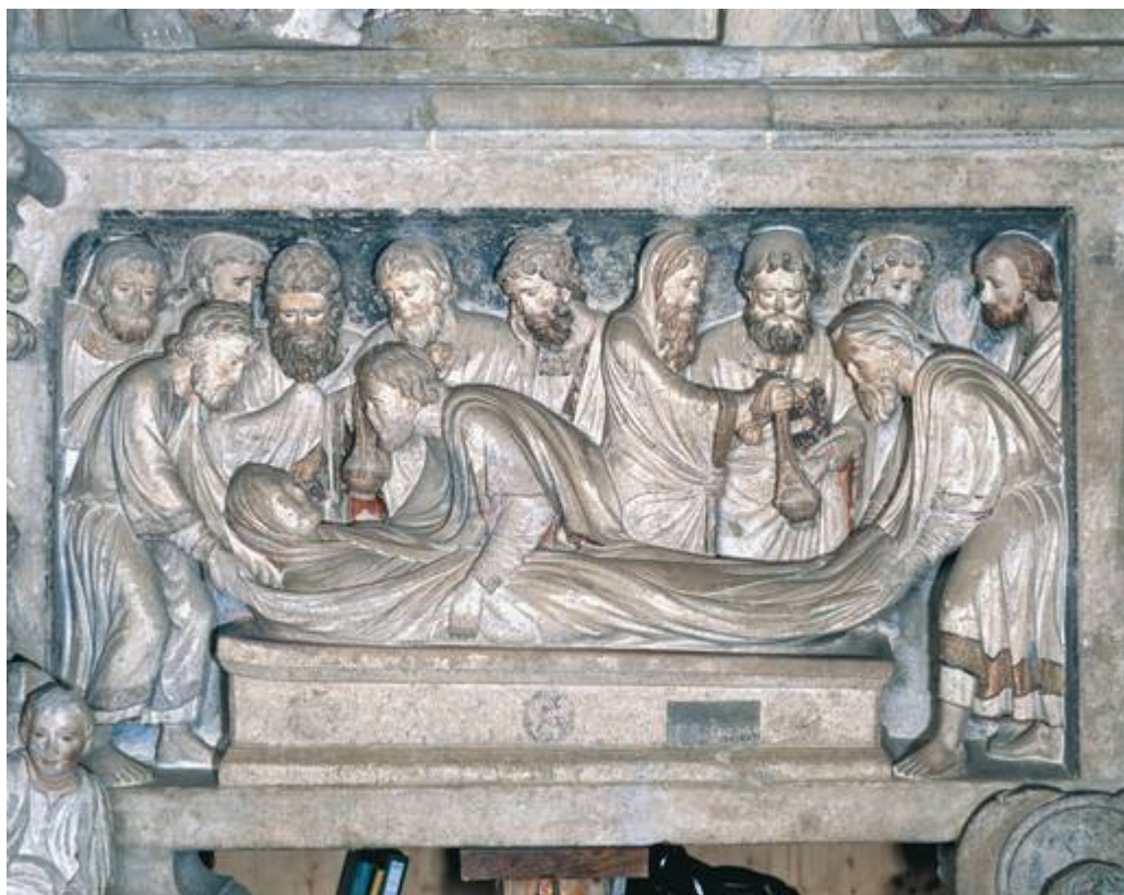
Росписной портал

Другие витражи Лозаннского собора, предшествующие знаменитым Шартрским, были созданы между 1205 и 1232 годами, вероятно, мастером Пьером д'Аррасом.