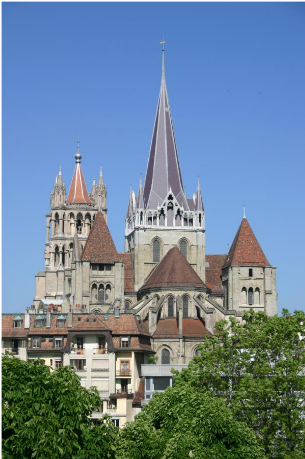
Лозаннский собор

Расписной портал на южном фасаде завершил памятник около 1225-1235 годов. 13-м веком датируется и одна из главных достопримечательностей собора – круглый витраж («роза»), выполненный Вилларом де Оннекуром по время его учебных