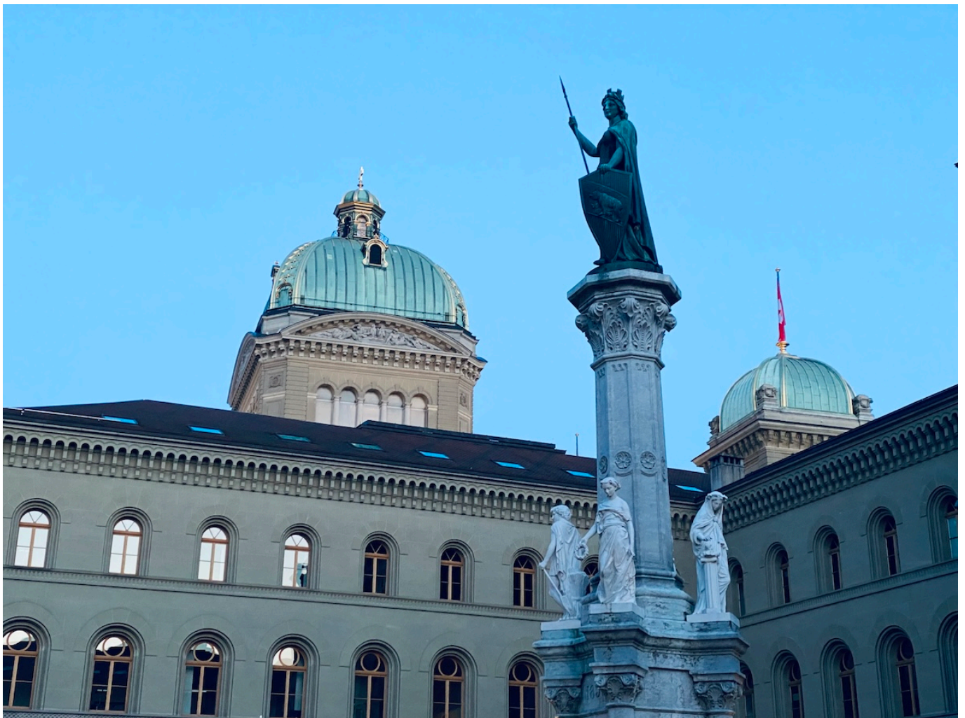
Федеральный дворец в Берне.