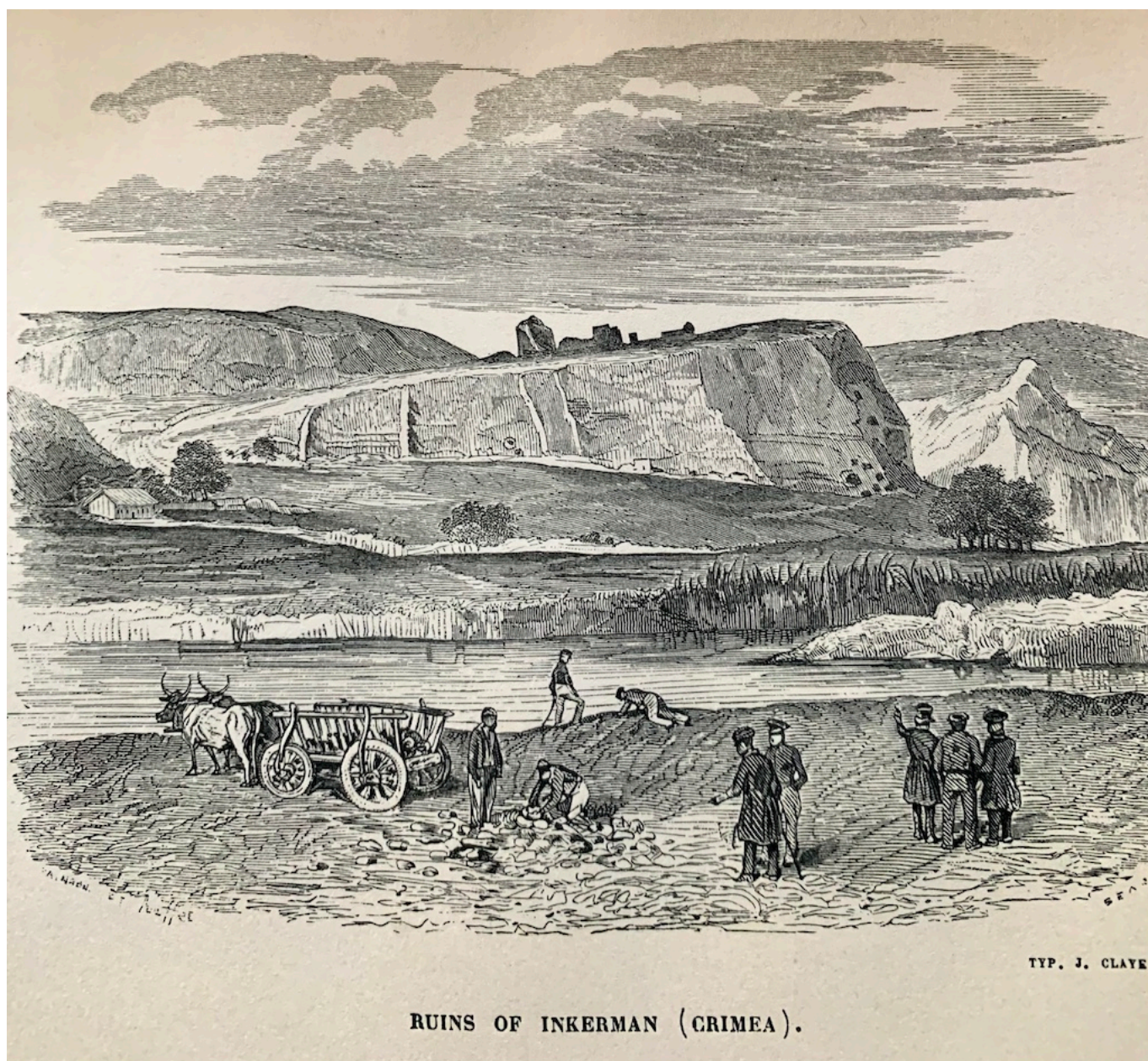
RUINS OF INKERMAN (CRIMEA).

Автор: Надежда Сикорская, Лугано , 18.03.2025.