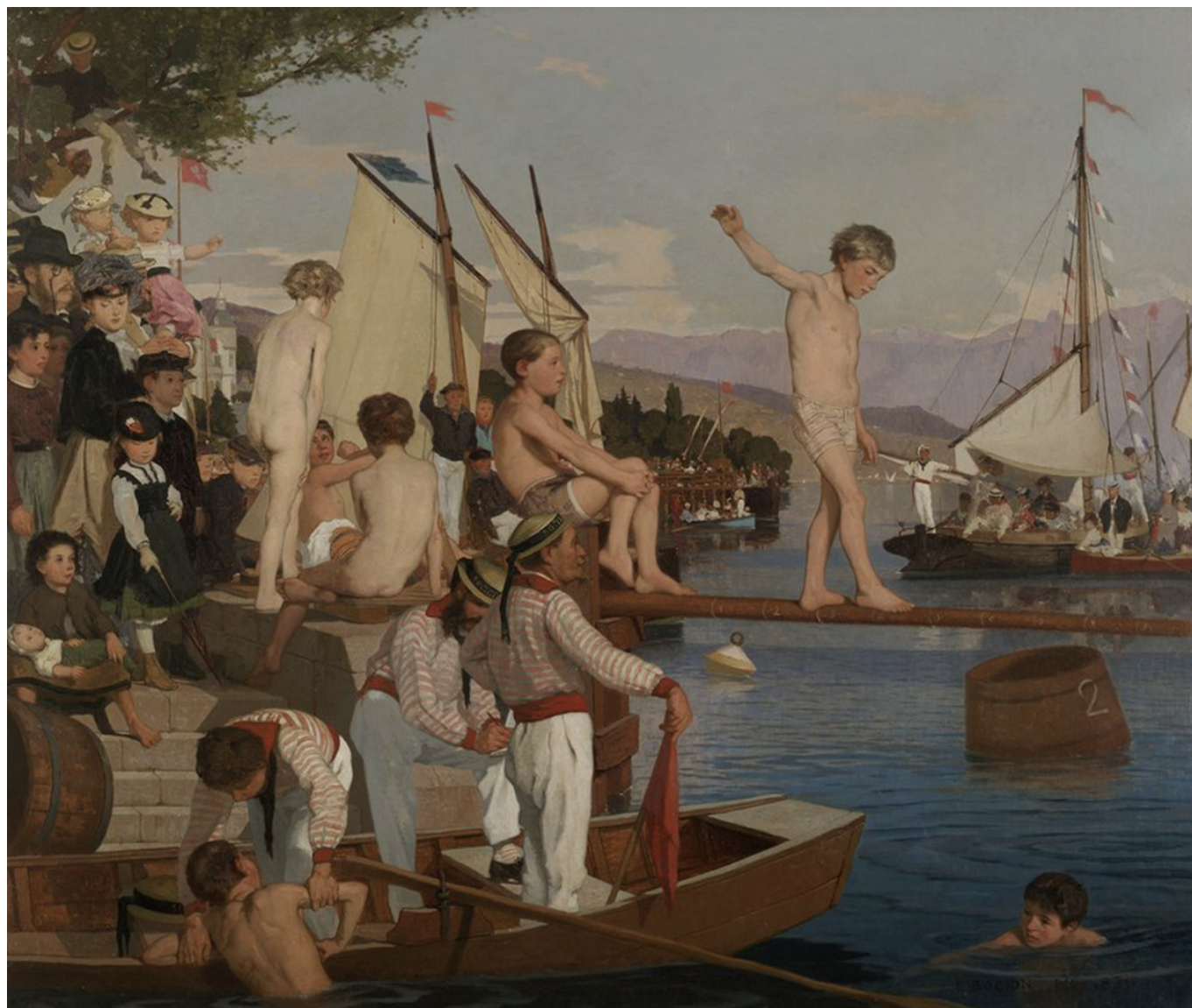
Франсуа Боссьон, «Праздник навигации», 1870 г.

Исторического музея Лозанны. Художник-импрессионист запечатлел на холсте популярное событие, которое посещала вся лозаннская знать. Праздник навигации был впервые проведен в 1845 году по инициативе семьи де Сержа. Для организации фестиваля, который проходил ежегодно вплоть до 1960 года, было создано Водуазское навигационное общество. Программа праздника включала игры, регаты, гонки гребцов, балы, концерты, фейерверки и маскарад.