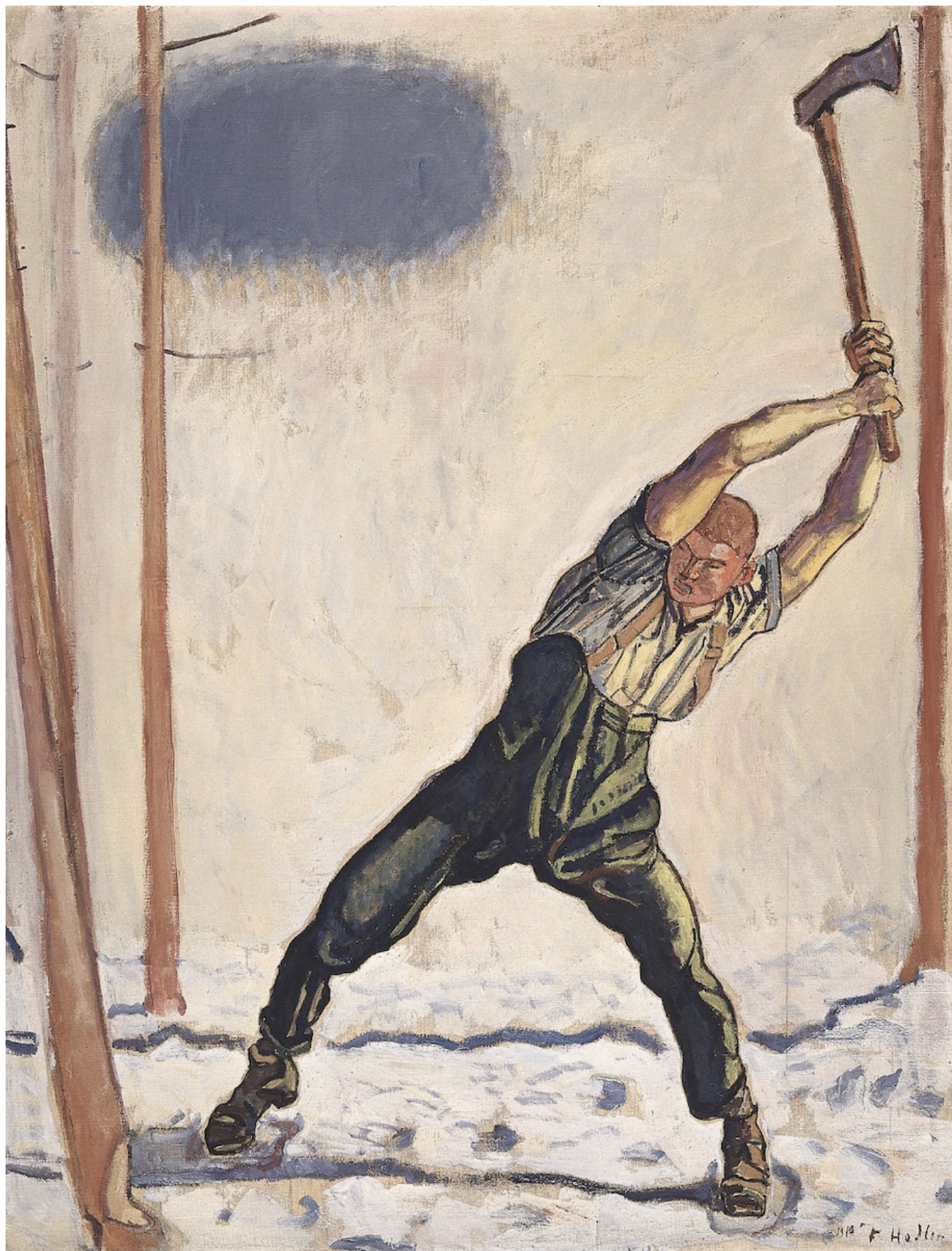
Фердинанд Ходлер, «Дровосек», 1910 г. Художественная коллекция La Mobilière