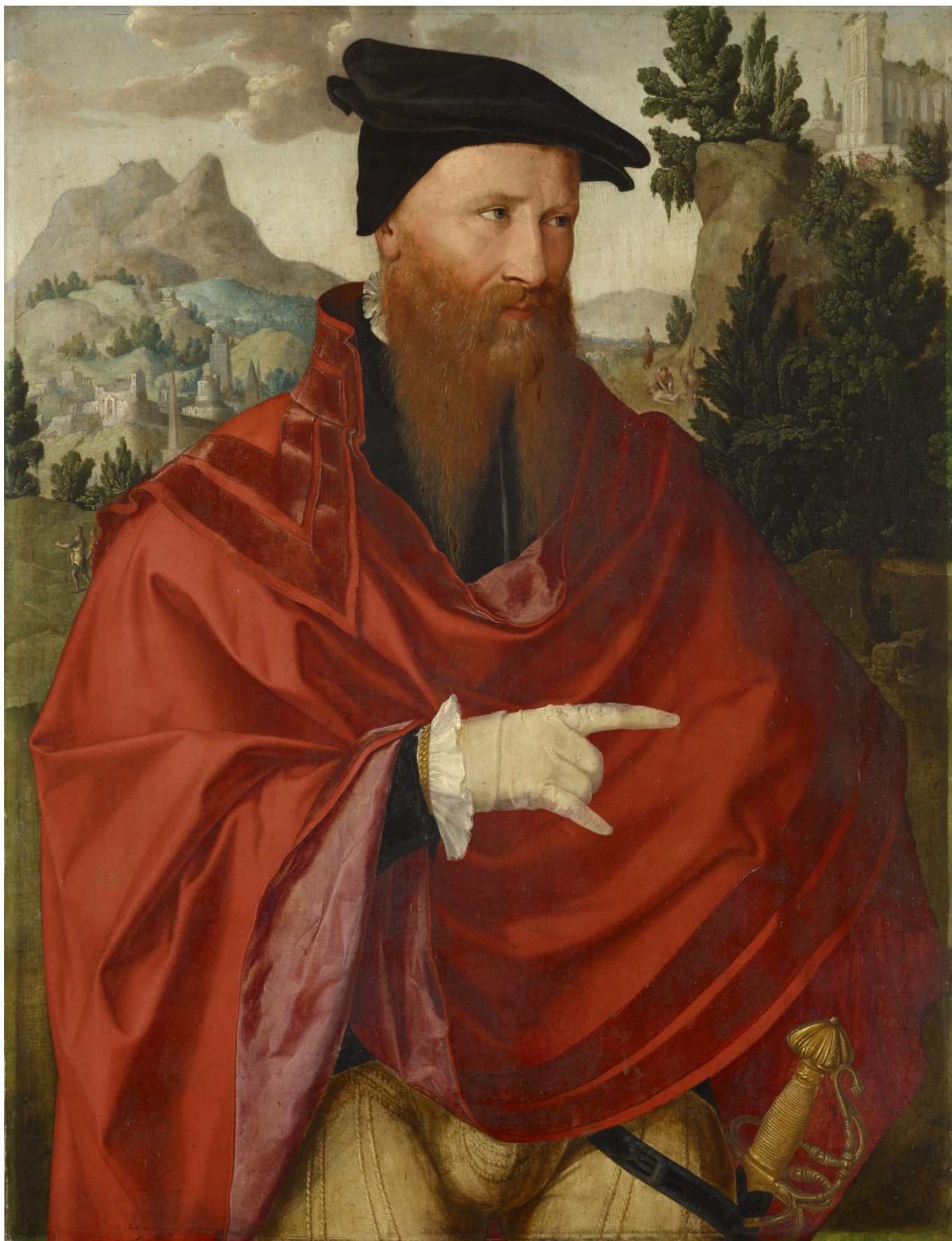
Голландский мастер. Портрет анабаптиста Давида Мориса, ок. 1540/1545 гг. Kunstmuseum Basel / Photo : Martin P. Bühler

Для того, чтобы показать всю эту невиданную красоту и сделать тайное явным, кураторы выставки придумали интересный ход. Вместо привычной всем нам традиционной музейной развески по стенам они разместили работы на специальных