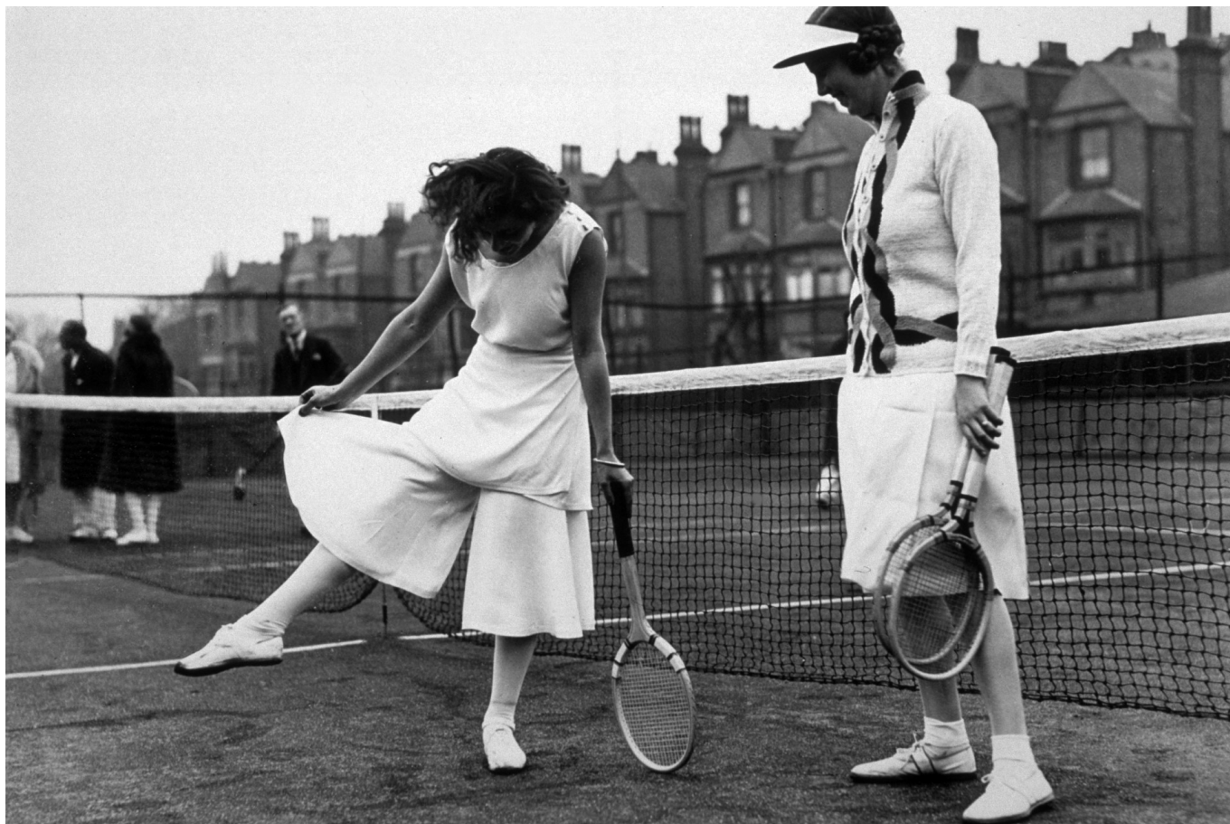
Испанская теннисистка Лили Альварес демонстрирует свою юбку-кюлоты от Schiaparelli на чемпионате Северного Лондона в Хайбери, 1931 год

поло. Легенда гласит, что в 1933 году теннисист Рене Лакост просто отрезал рукава своей рубашки, которые были слишком тесными. Кроме того, он вместе с Андре Жилье разработал хлопок пике, впитывающий влагу и пропускающий воздух. В целом, в 1920-1930-х годах спорт был повсюду: модные журналы пестрели статьями о занятиях спортом и спортивной экипировке, а модельеры открывали спортивные линии. Разглядывать созданные модными иллюстраторами эпохи ар-деко эскизы платьев для тенниса или гольфа – отдельное удовольствие!