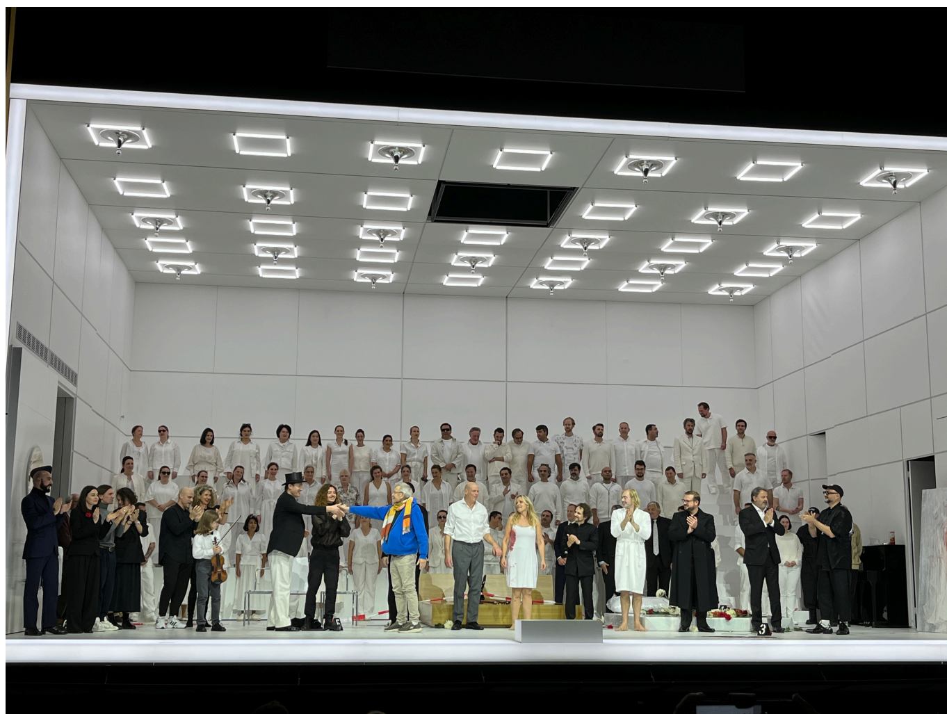
Поклоны и овация в конце спектакля

Идиотство заразительно и заразно. Вот уже и Жена рвет шторы и книги и ходит по нужде прямо на ковер, чем в конце концов выводит из терпения Мужа и Идиота (двух идиотов?). «Тогда мы ее избили, не очень больно, раздели для забавы и избили, хохоча над ее дурацкими титьками, которые резво подпрыгивали, пока мы ее били, но, однако, она все-таки потеряла сознание – и титьки стали совсем уж дурацкими, и мы даже всплакнули над их бесповоротной глупостью», - читали зрители, запрокинув головы. Интересно, испытывают ли они сострадание и припоминают ли, что именно за его нехватку и расплачивается идиот «Я»?