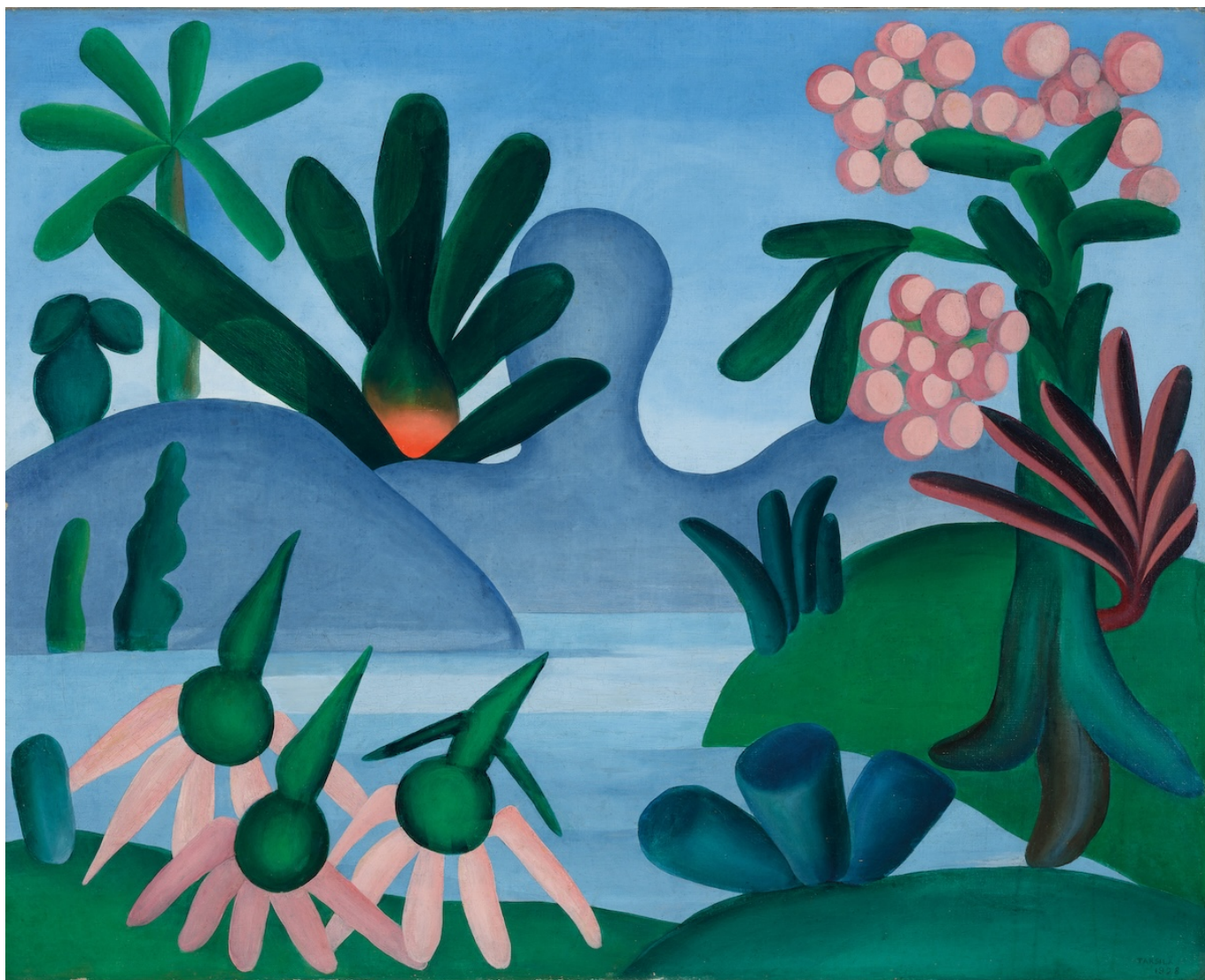
Тарсила ду Амарал. Озеро, 1928.

Автор: Заррина Салимова, Берн-Базель-Бургдорф-Нион , 04.10.2024.