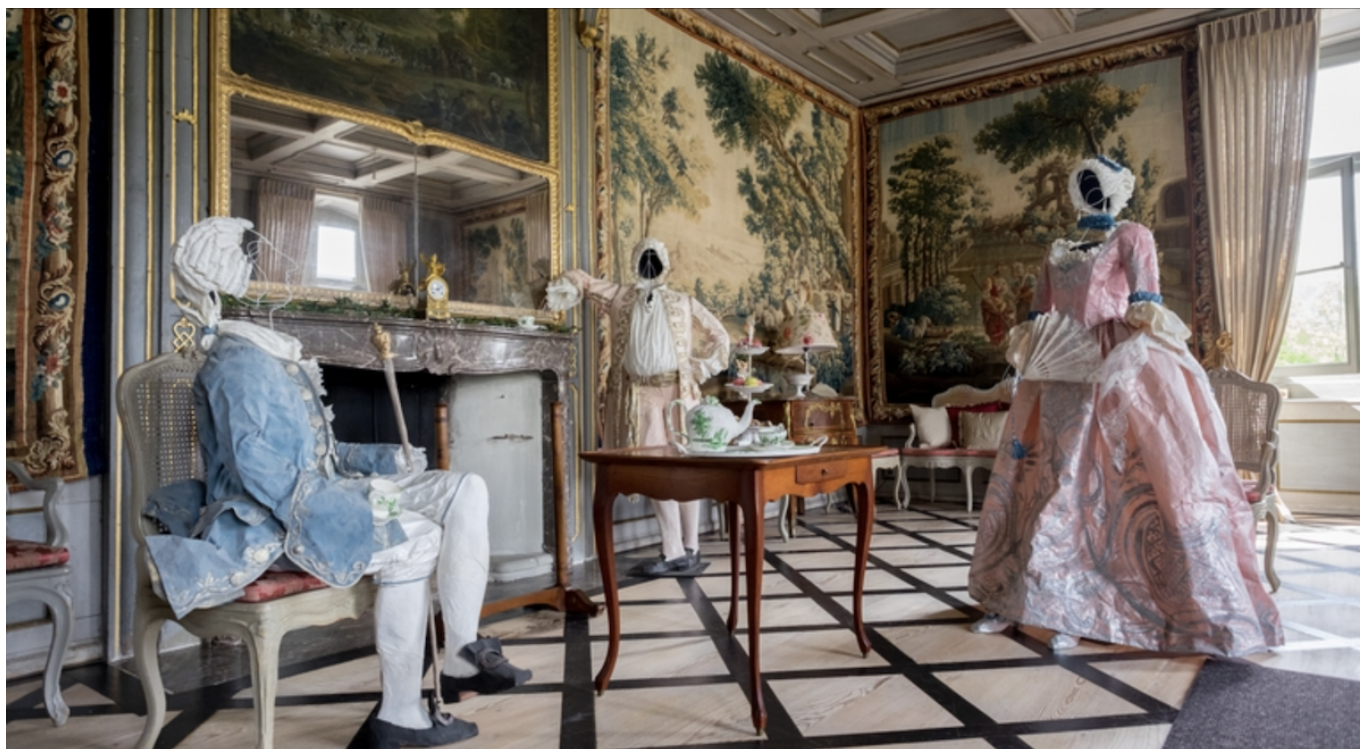
Фото: Château de Nyon выставки в швейцарии музеи в Швейцарии

исторических костюмов, которые она создает с помощью красок и бумаги. Она рисует цветы, вышивку и кружева с таким мастерством, что простая и незамысловатая бумага становится похожей на богатые ткани XVIII века. Сама выставка была задумана для Берлина еще в 2012 году. В честь 300-летнего юбилея со дня рождения короля Пруссии Фридриха II Изабель де Боршграф получила заказ на изготовление бумажных работ, иллюстрирующих «Модную обезьяну» – написанную Фридрихом II пьесу, представляющую собой карикатуру на господ, одержимых желанием хорошо выглядеть. Созданные художницей бумажные костюмы имели огромный успех. В Нионе они демонстрируются на легких стальных каркасах, расставленных в исторических интерьерах: побродить по замку в сопровождении призраков в нарядах XVIII века? Да это же отличная идея накануне Хэллоуина!