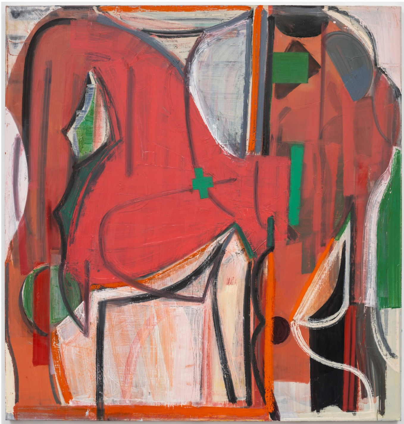
Эми Силлман. Маленький слон, 2023.