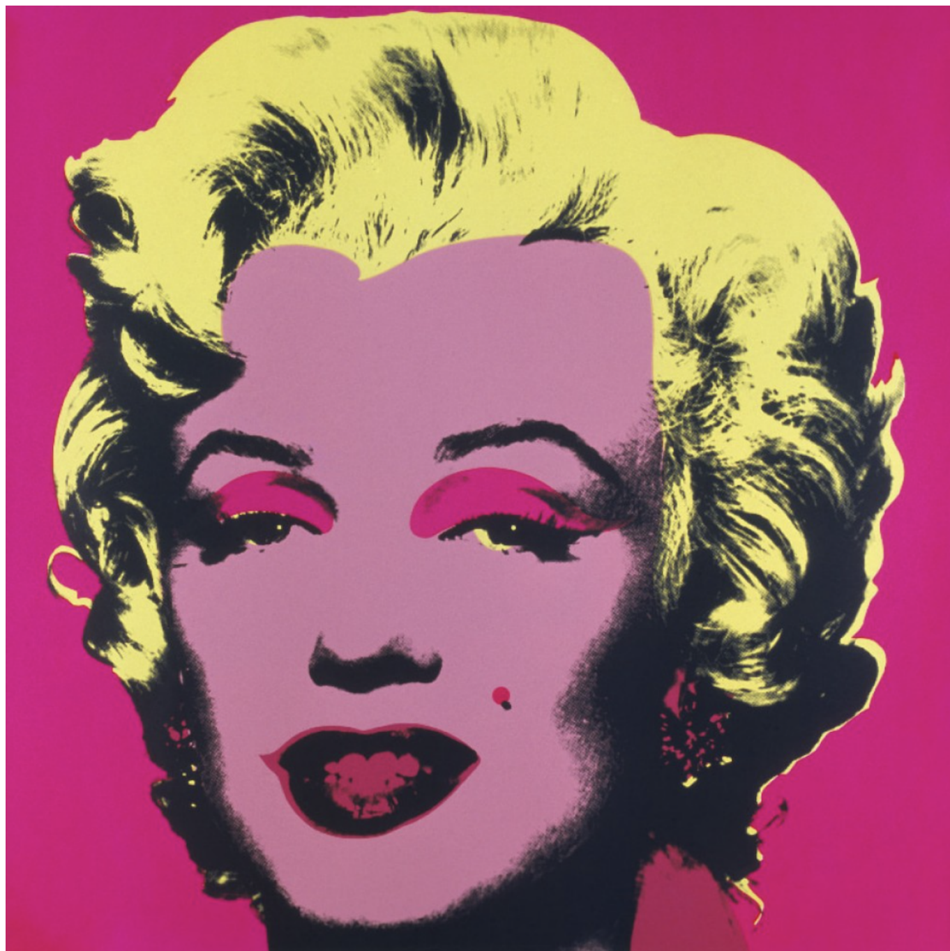
Энди Уорхол. Мэрилин Монро, 1967. Louisiana Museum of Modern Art, Humlebaek, Denmark

Живописный городок Бургдорф порадовал масштабной выставкой, включающей несколько десятков лучших работ из коллекции датского музея современного искусства «Луизиана». Рой Лихтенштейн, Энди Уорхол, Марк Ротко, Герхард Рихтер, Джексон Поллок, Зигмар Польке – если вы любите послевоенное и современное искусство, то не пропустите экспозицию в музее Франца Герча .