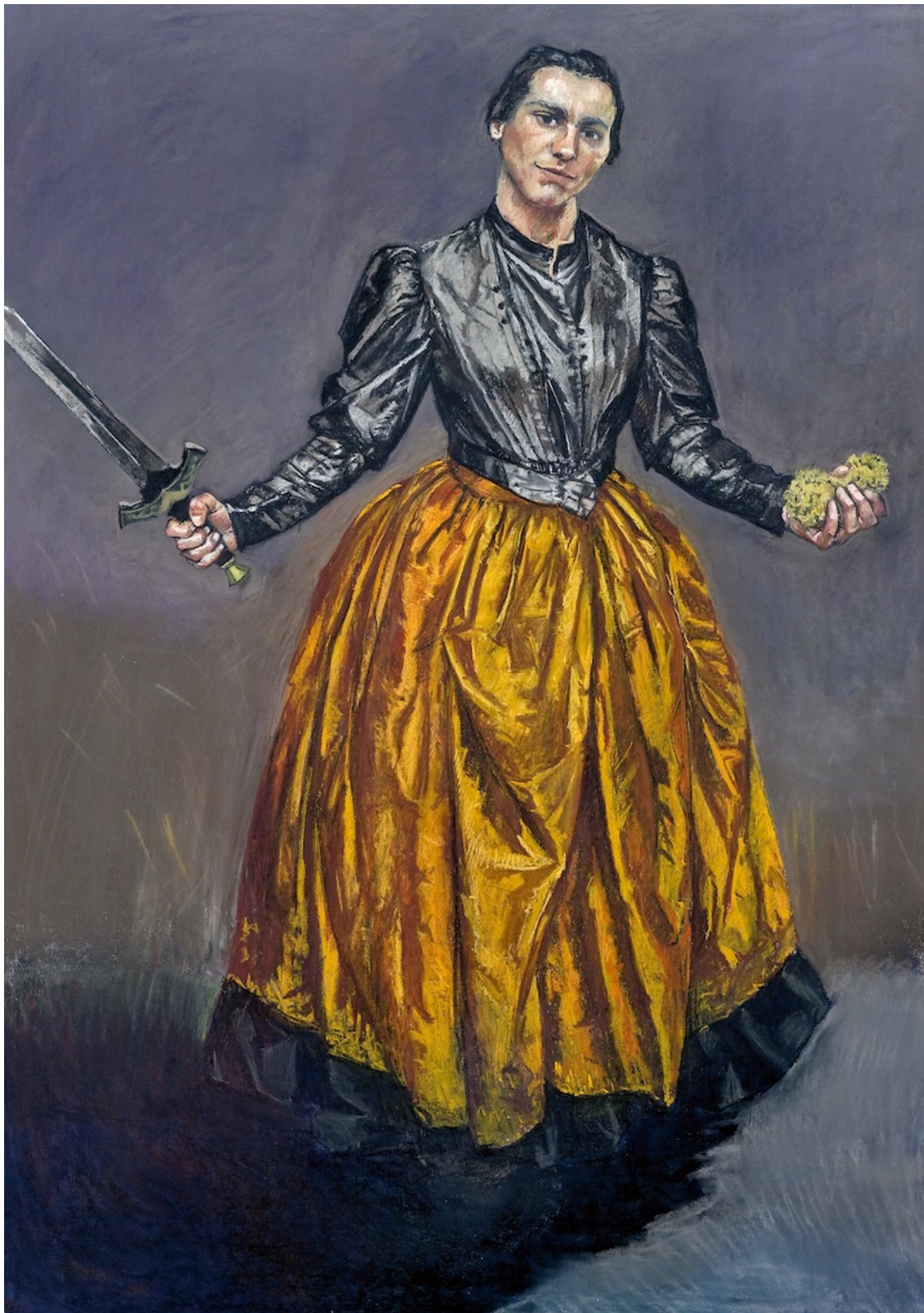
Паула Рего. Ангел, 1998. © Paula Rego. All rights reserved 2024 / Bridgeman Images.