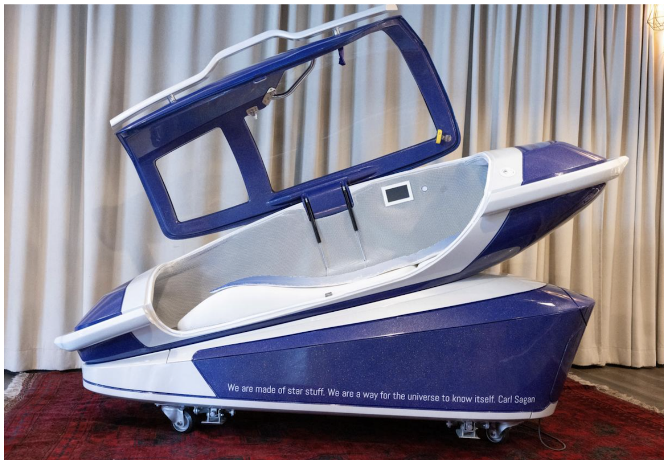
Фото: The Last Resort

Автор: Заррина Салимова, Шаффхаузен , 26.09.2024.