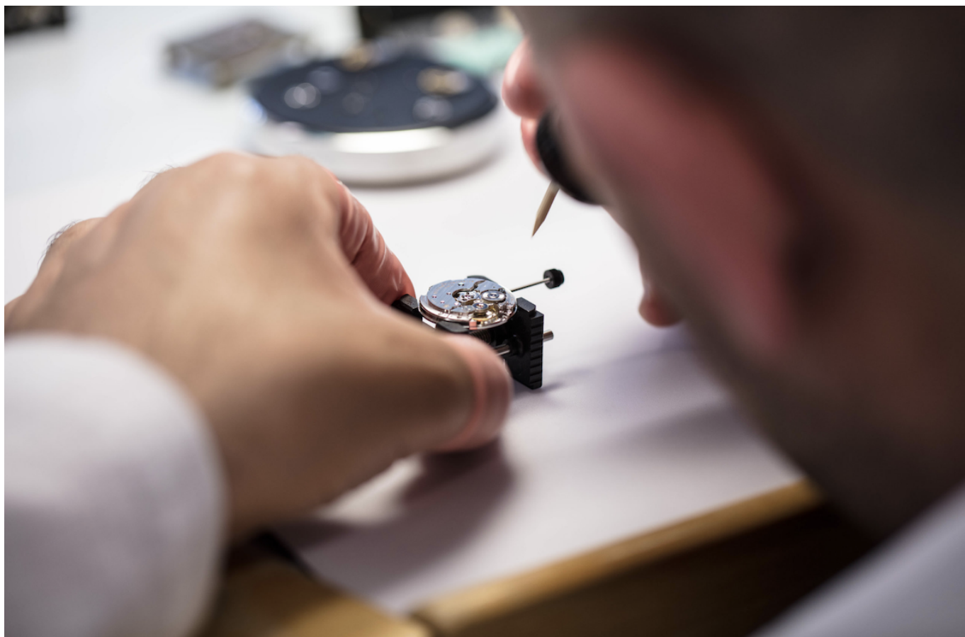
Фото: Convention patronale de l'industrie horlogère suisse (CP)

Автор: Заррина Салимова, Ла-Шо-де-Фон , 19.09.2024.