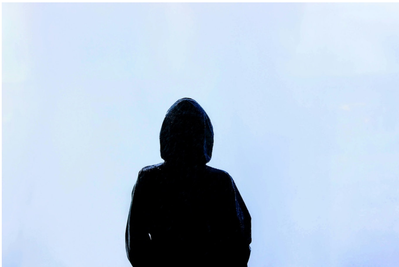
Фото носит символический характер.

Автор: Заррина Салимова, Сион , 10.09.2024.