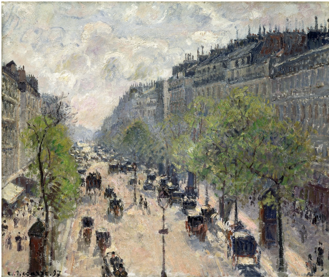
Камиль Писарро. Бульвар Монмантра, весна. 1897 г. Museum Langmatt, Baden