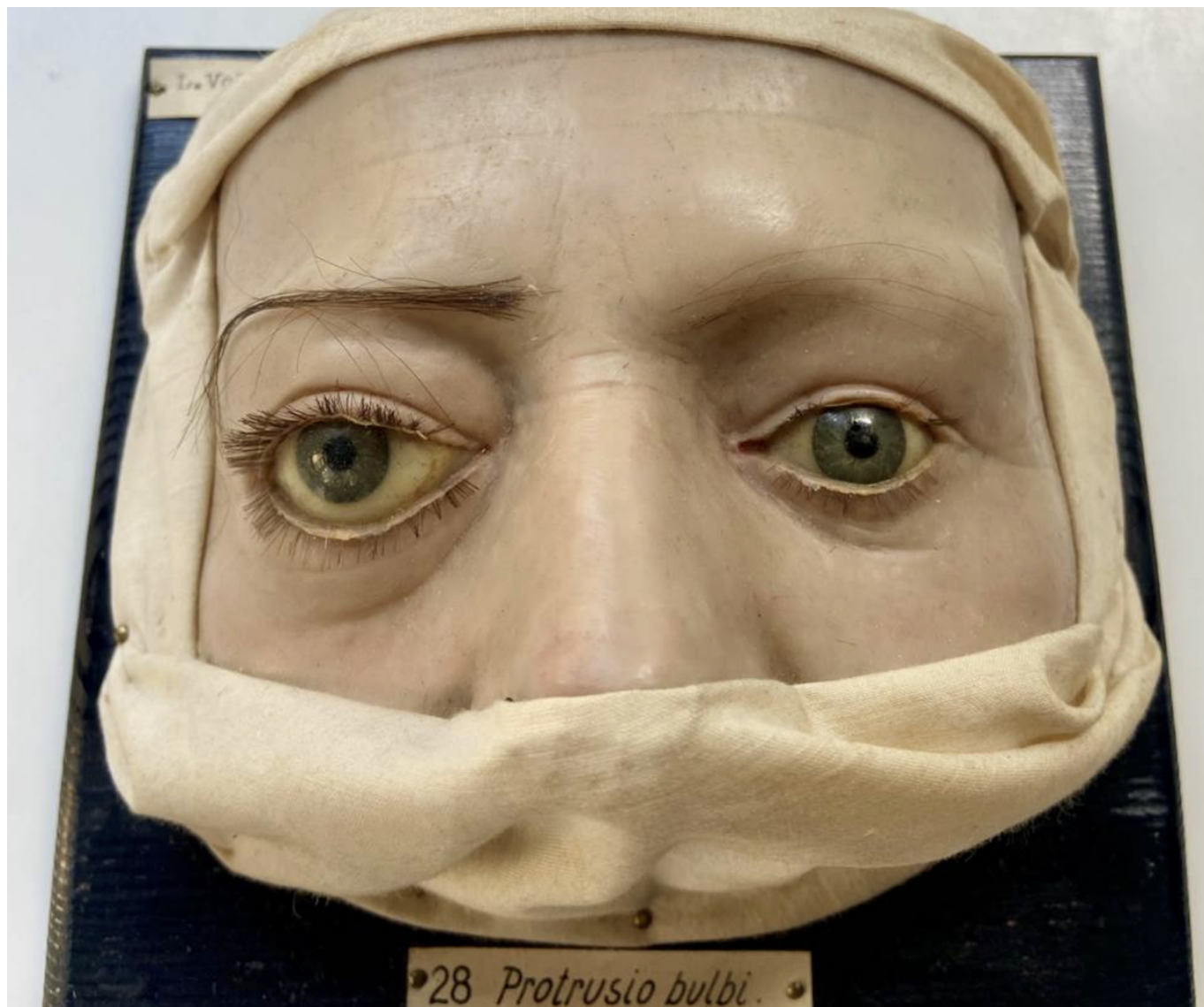
Жутковатые экспонаты Музея муляжа.

В «Ночь музеев» будут проводиться туры по церквям Старого города: рекомендуем прийти пораньше, чтобы забронировать места на экскурсию по колокольне Гроссмюнстера и по церкви Фраумюнстер, где расположены знаменитые витражи Марка Шагала . Тем же, кому хочется пощекотать нервы, стоит отправиться ночью в Музей о жизни и смерти на Зильфельдском кладбище, где похоронены Анри Дюнан, Готфрид Келлер и Йоханна Спири . Не менее острые эмоции ожидают тех, кто посетит Музей муляжа, где представлена одна из самых значительных в мире коллекций медицинских трехмерных репродукций больных частей тела. Техника изготовления муляжей позволяет добиться пугающе реалистичных результатов. Добавим, что билет стоит 25 франков (детям до 17 лет – бесплатно). В стоимость включен проезд на общественном транспорте (VBZ Zone 110 / Stadt Zürich), специальных музейных шаттлах и корабле «MS Sentosa».