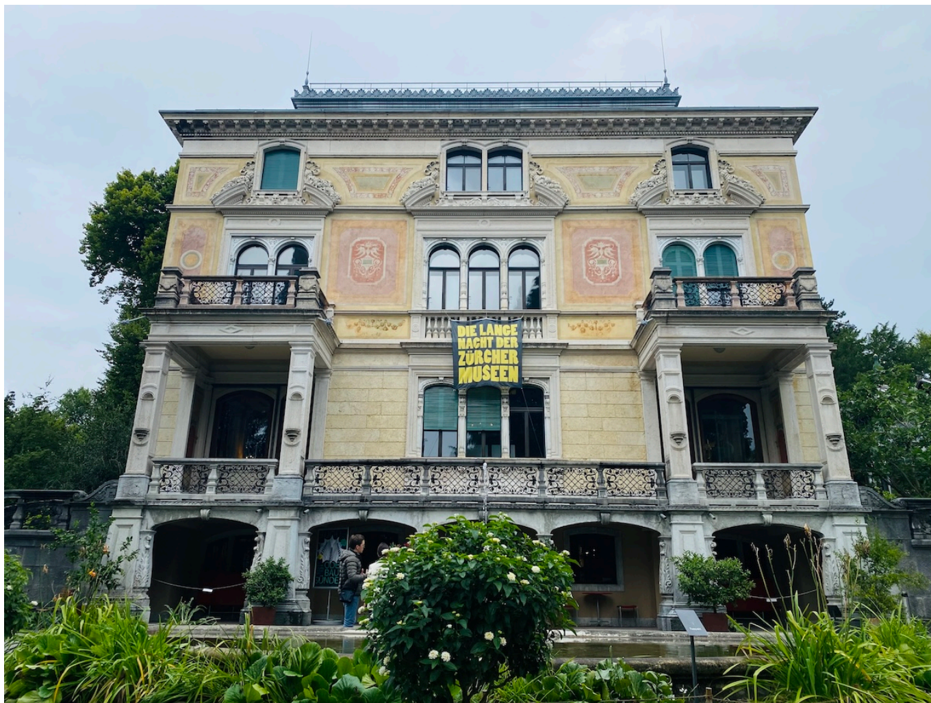
Вилла "Патумба".