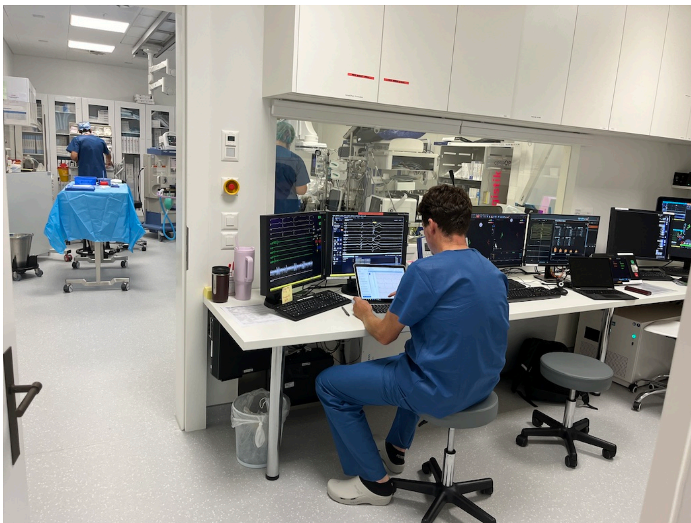
Тише, идет операция!

Аритмия или, по-научному, фибрилляция предсердий – наиболее частое нарушение сердечного ритма, которое, как правило, возникает в старости, когда сердце изнашивается и из ритма выбивается. Но не обязательно: среди пациентов доктора Зальцберга есть люди и пятидесяти-шестидесяти лет. Откуда же берется эта напасть и можно ли ее предотвратить?