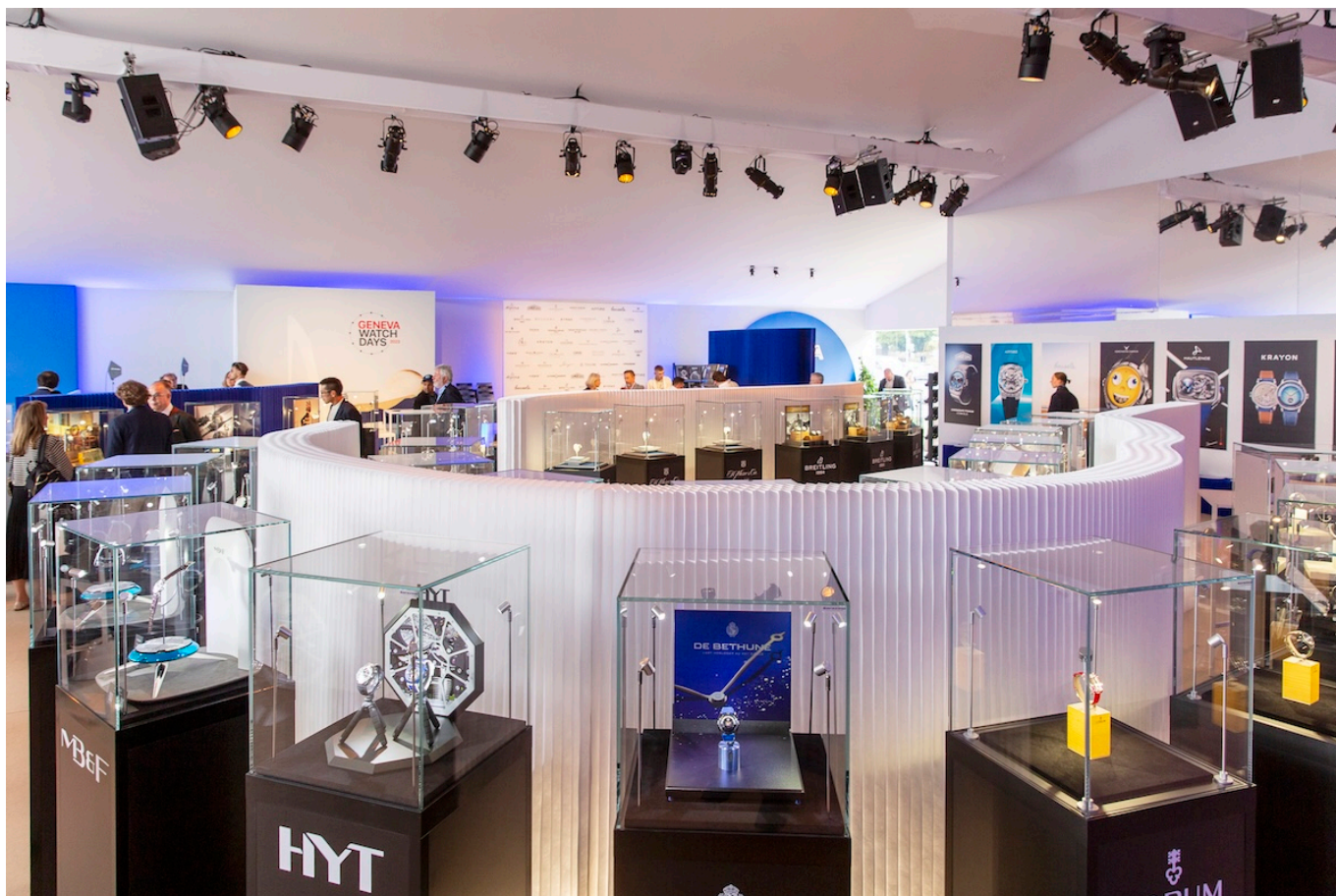
Фото: Geneva Watch Days

Автор: Заррина Салимова, Женева , 29.08.2024.