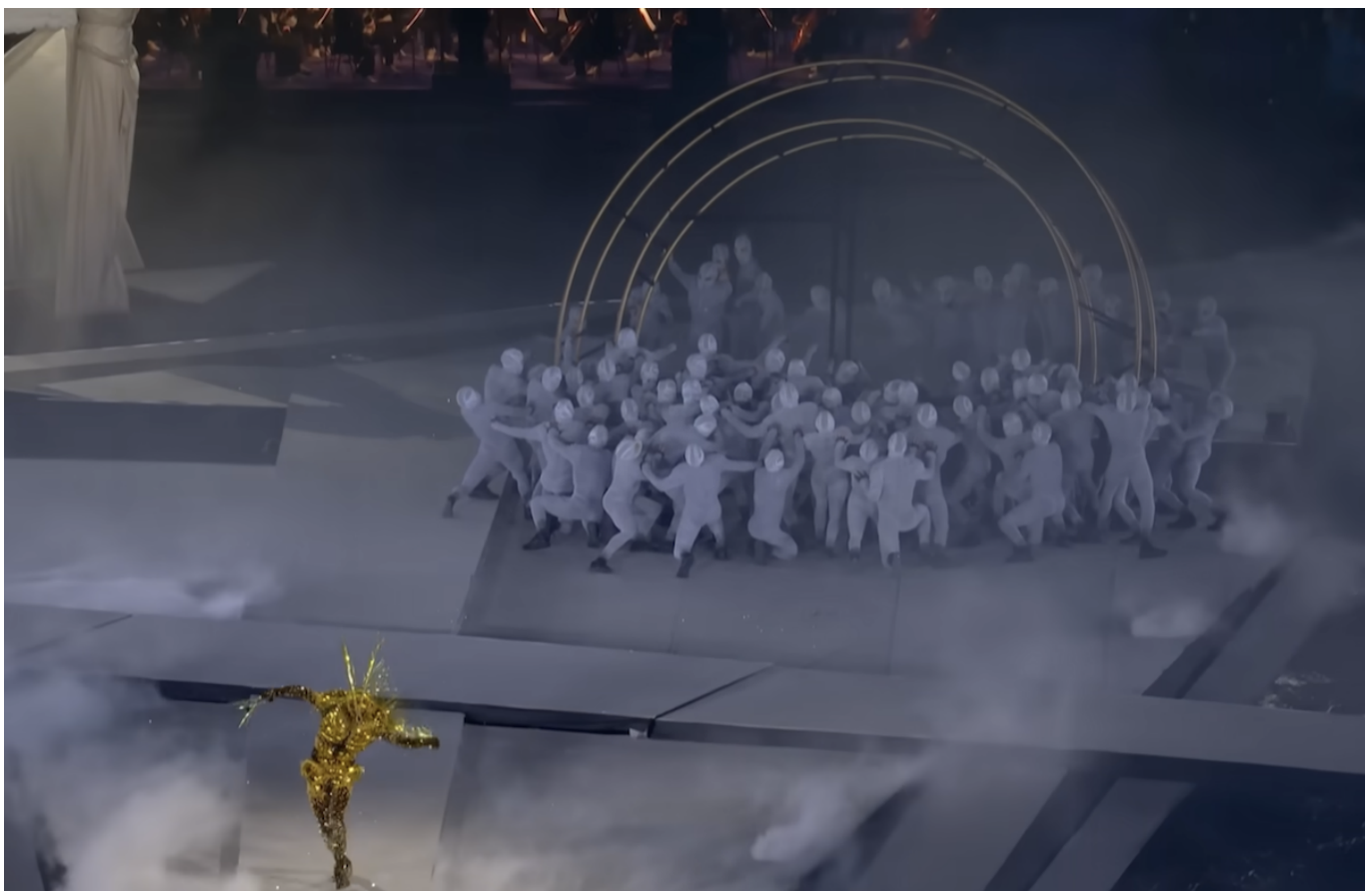
Скриншот записи церемонии открытия

Нашим постоянным читателям это имя может показаться смутно знакомым – и не зря. Мы уже рассказывали о творчестве 32-летнего уроженца кантона Вале, когда он решил удивить гостей парижской недели моды, устроив модный показ под аккомпанемент валезанского духового оркестра. Новый толчок его карьере дала Олимпиада: организаторы доверили швейцарскому дизайнеру, наряды от которого носят Тейлор Свифт, Леди Гага, Бейонсе и Рианна, создание костюмов для финального шоу.