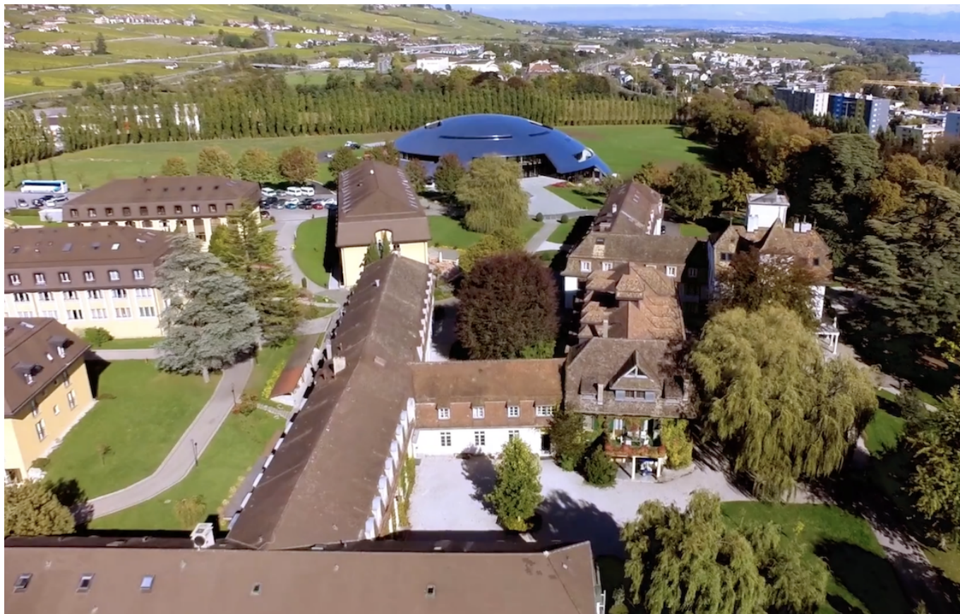
Скриншот видео о кампусе Institut le Rosey

В колледже Aiglon, что переводится как "Орленок", обучаются около 400 учеников, родители которых готовы заплатить от 103 100 до 171 900 долларов в год. Школа расположена в живописной водуазской коммуне Шезьер, недалеко от горнолыжного курорта Виллар-сюр-Оллон. Учебная программа основана на британской модели. Основное внимание уделяется упорному труду, а серьезные академические требования сочетаются с широким спектром внеклассных мероприятий. В этом году все 66 учеников, обучавшихся по программе IBDP, сдали экзамен, при этом 88% выпускников набрали 30 и более баллов, а 29% учащихся – 40 и более баллов. Школа располагает самой современной инфраструктурой, включая первоклассные музыкальные и театральные залы. Катание на лыжах, походы в горы, прогулки и поездки на природу – неотъемлемая часть школьной жизни орлят, учащихся здесь летать.