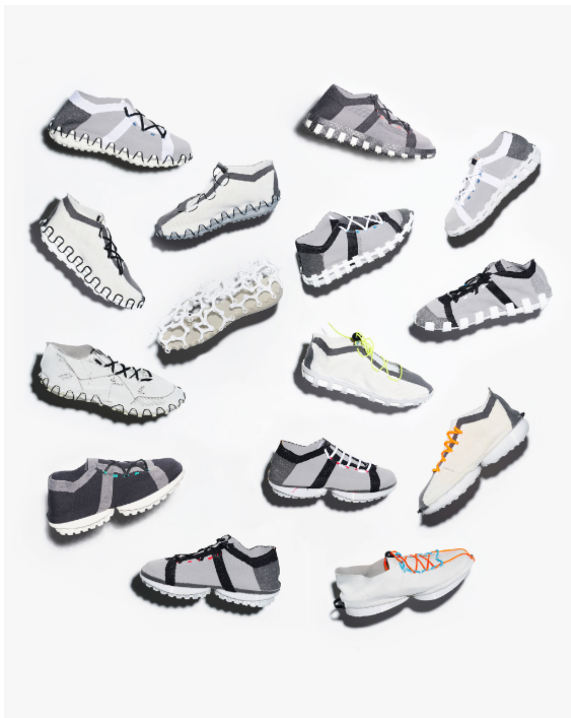
Кроссовки Disassembly Lab