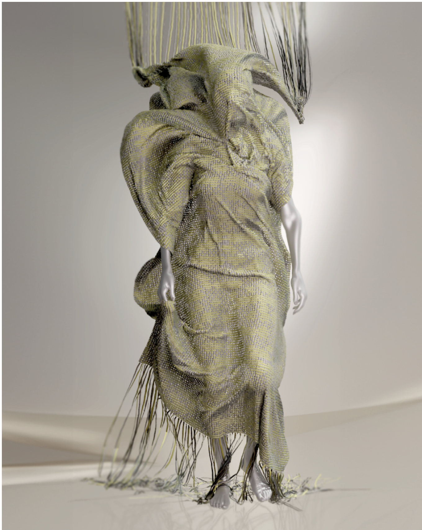
Augmented Weaving.