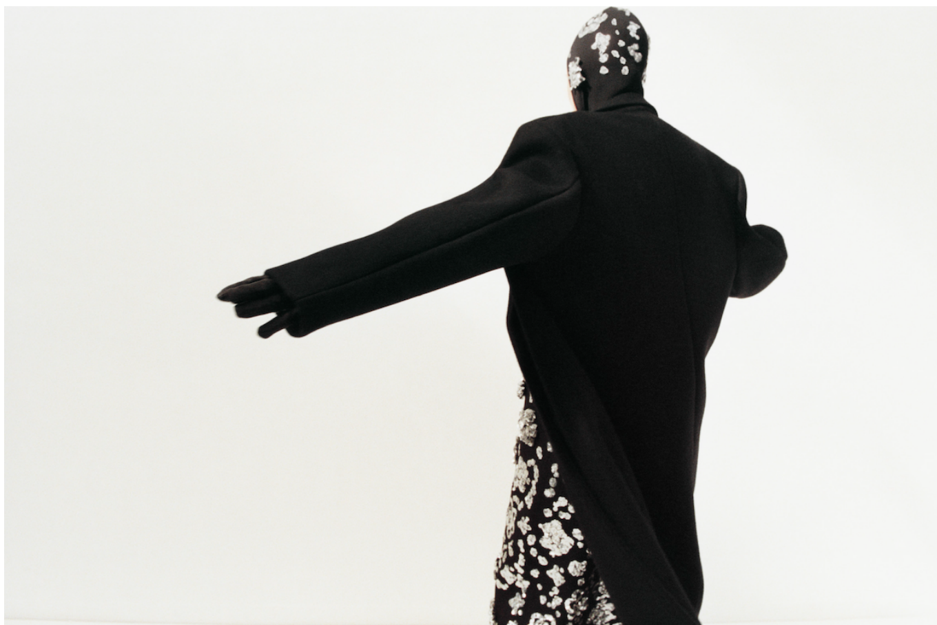
Jil Sander FW 2023