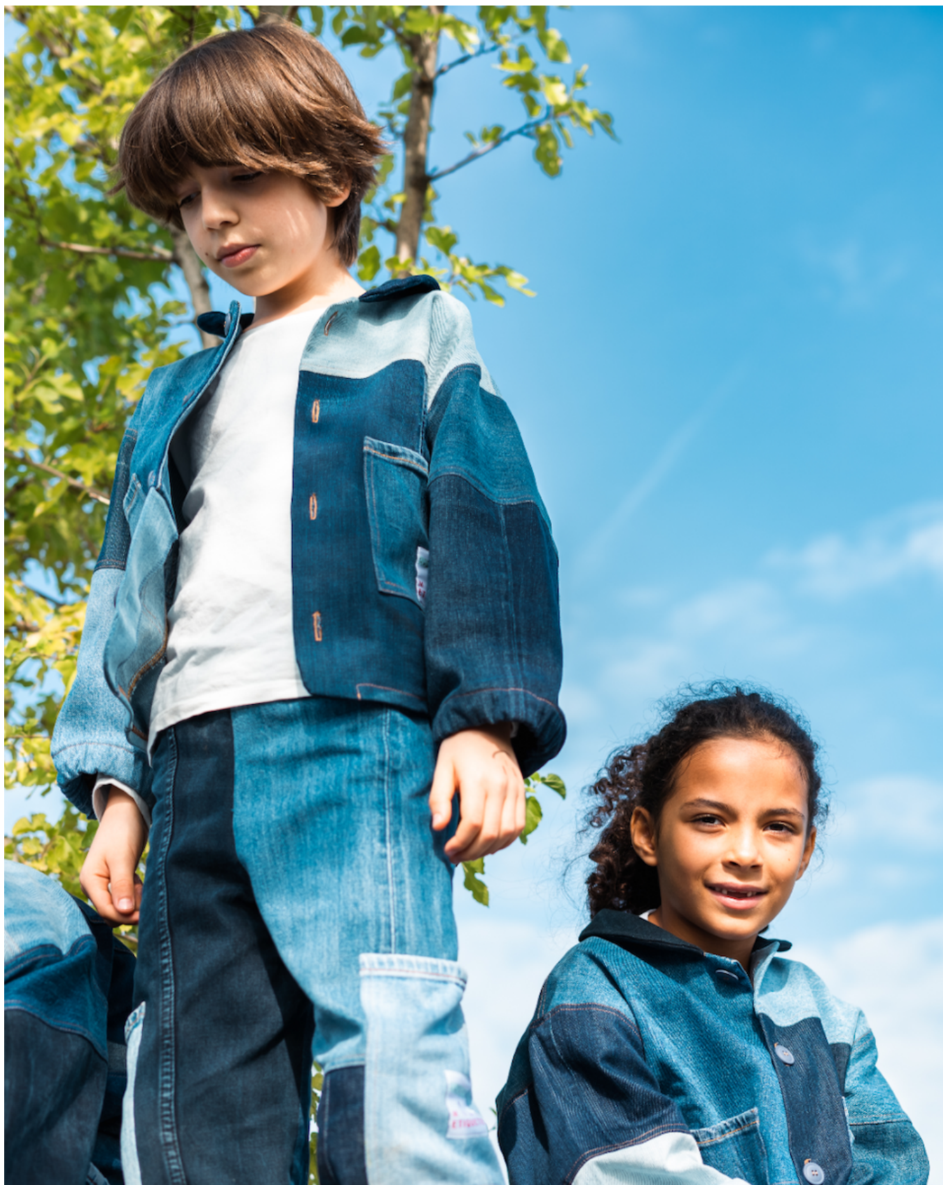
Коллекция детской одежды в стиле пэчворк из переработанного денима от Mini Etiquette

Rrrevolve они выпустили линию детской одежды, пошитой из кусочков джинсовых брюк, которые больше не подлежат восстановлению или не поступили в продажу из-за производственного брака.