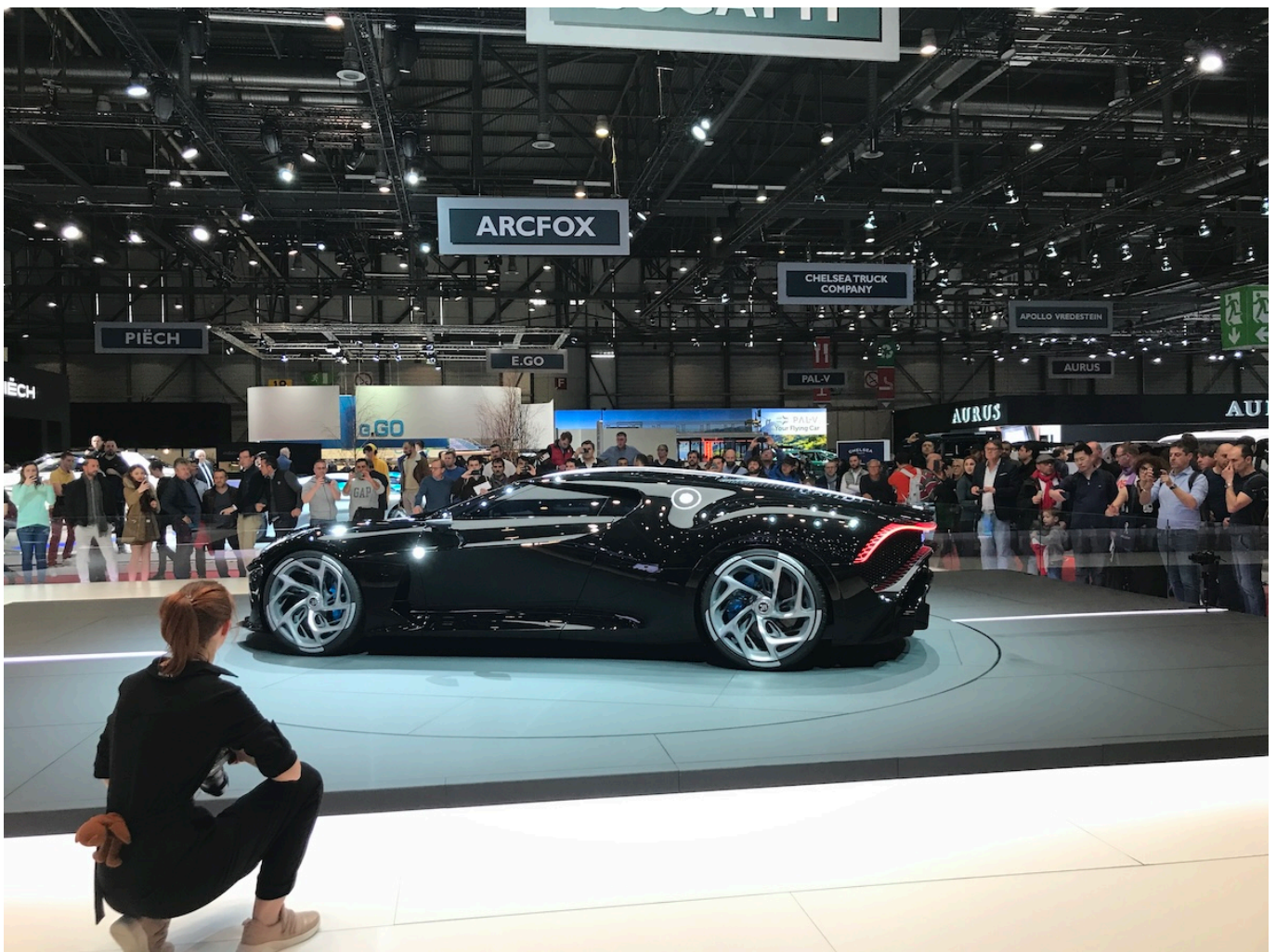
La Voiture Noire от Bugatti на Женевском автосалоне в 2019 году.

С 1982 года салон проводился в Palexpo, достигнув пика в 2005 году, когда 747 000 человек приехали в Женеву, чтобы увидеть мировую премьеру Alpha Romeo Brera и Citroën C6. В течение всей своей истории Женевский салон был площадкой для презентации автомобилей, ставших впоследствии культовыми и революционными, например, Jaguar E-Type, который Энцо Феррари считал – и с ним сложно не согласиться! – самым красивым автомобилем в мире, или La Voiture Noire от Bugatti – один из самых дорогих автомобилей в мире, выпущенный в единственном экземпляре.