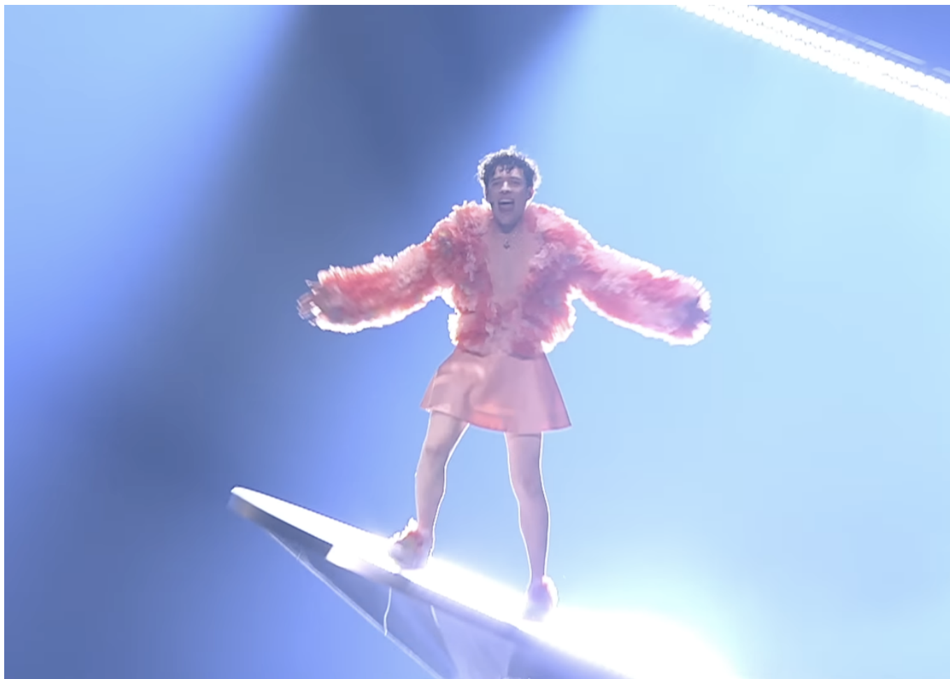
Выступление Немо в финале «Еurovision-2025».

Автор: Заррина Салимова, Мальме-Берн , 13.05.2024.