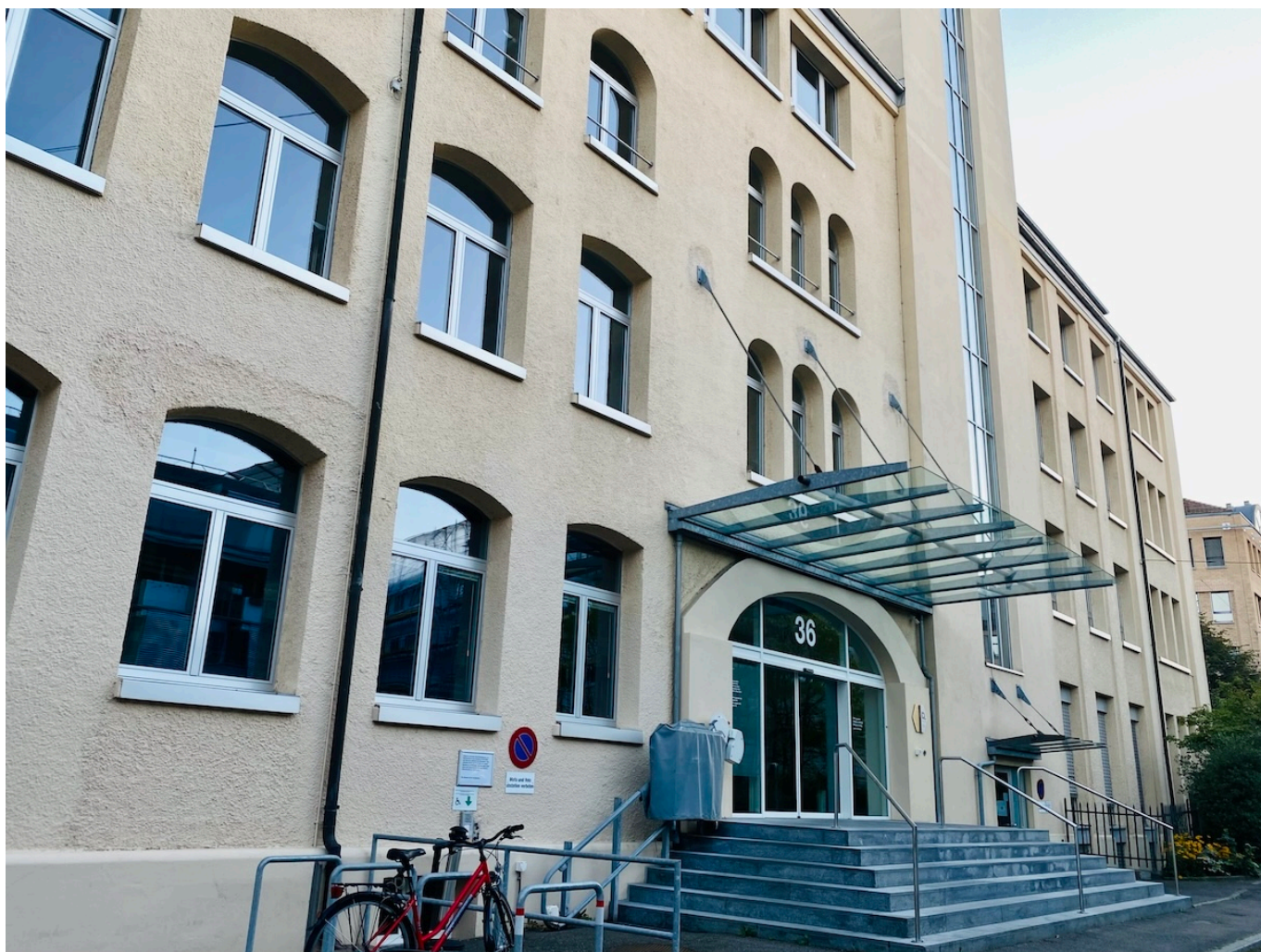
Офис SECO в Берне.