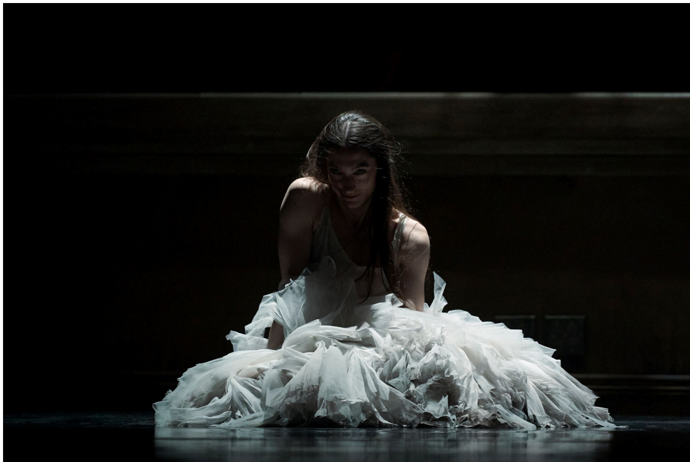
Кидд Пиво. Assembly Hall