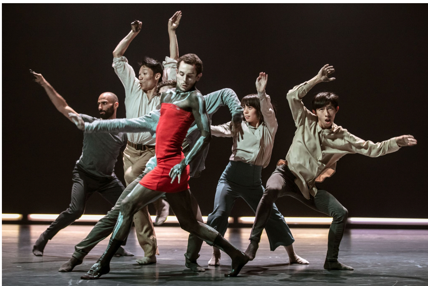
"Winter Guests"

Автор: Ника Пархомовская, Цюрих , 23.04.2024.