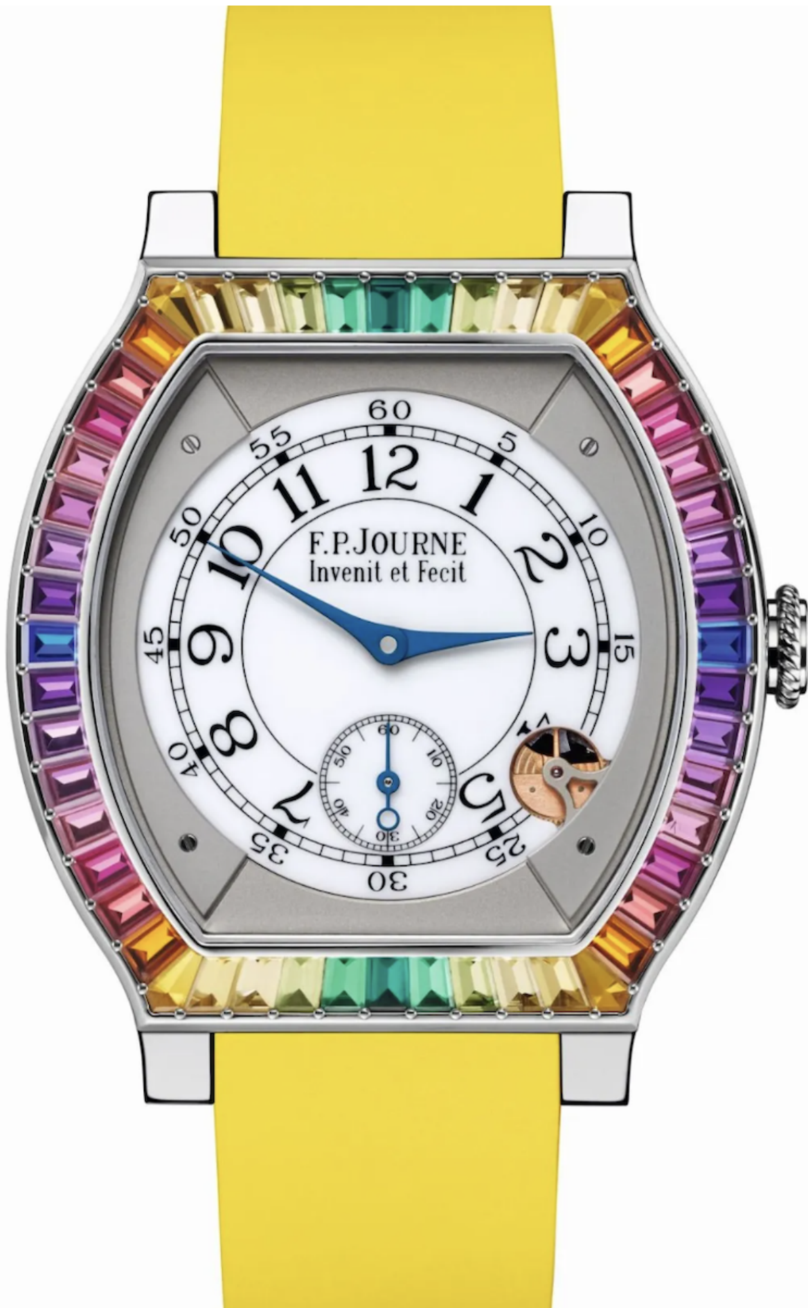
Модель élégante Gino's Dream

Приятных вам часовых открытий, дорогие читатели!