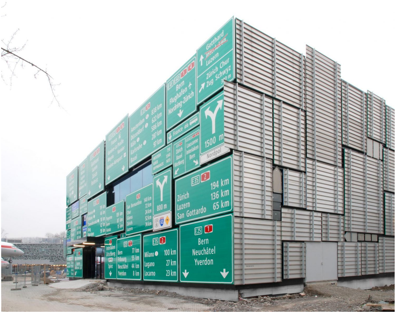
Gygon / Gruyer