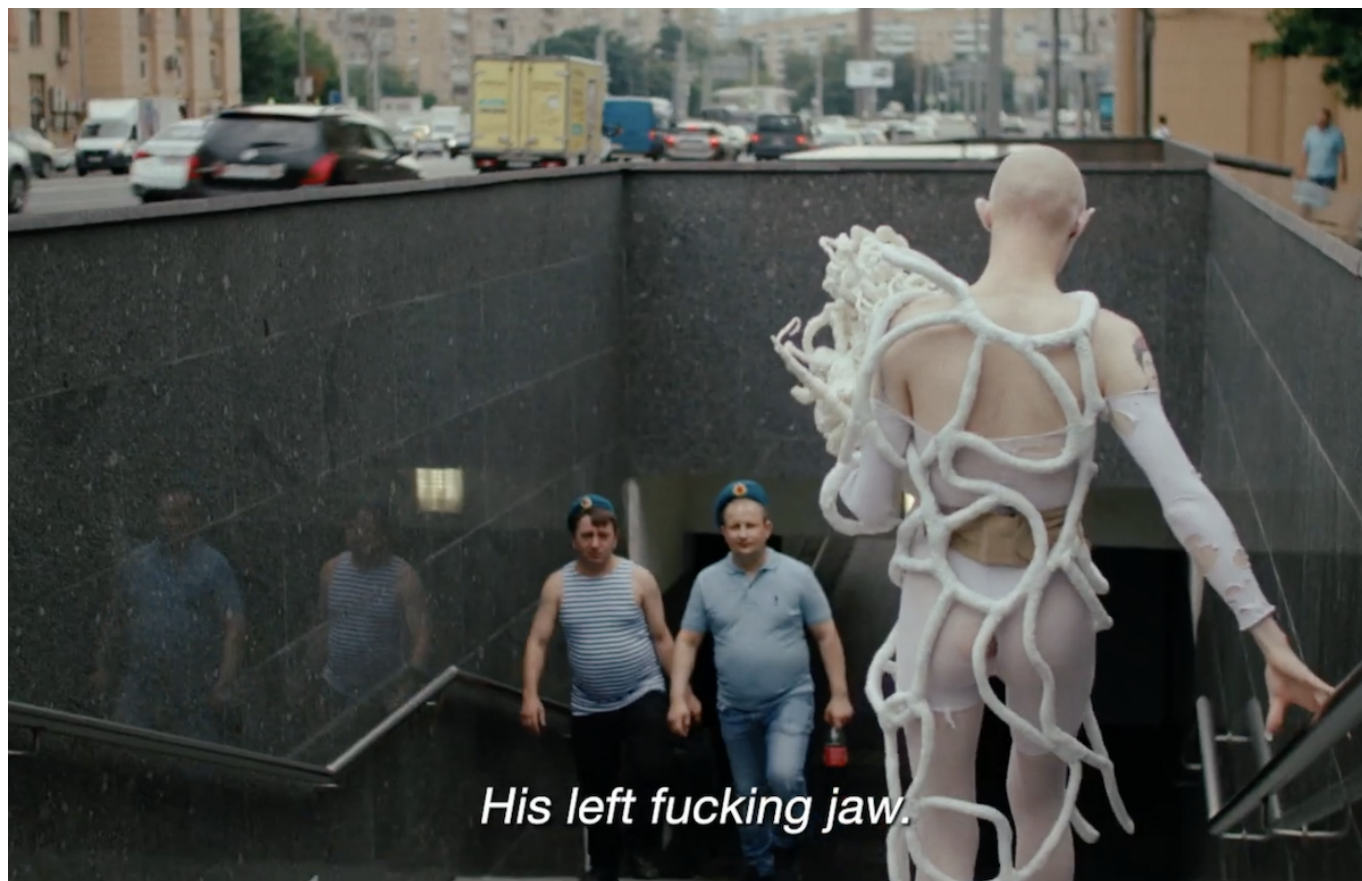
Кадр из фильма «Квиндом»