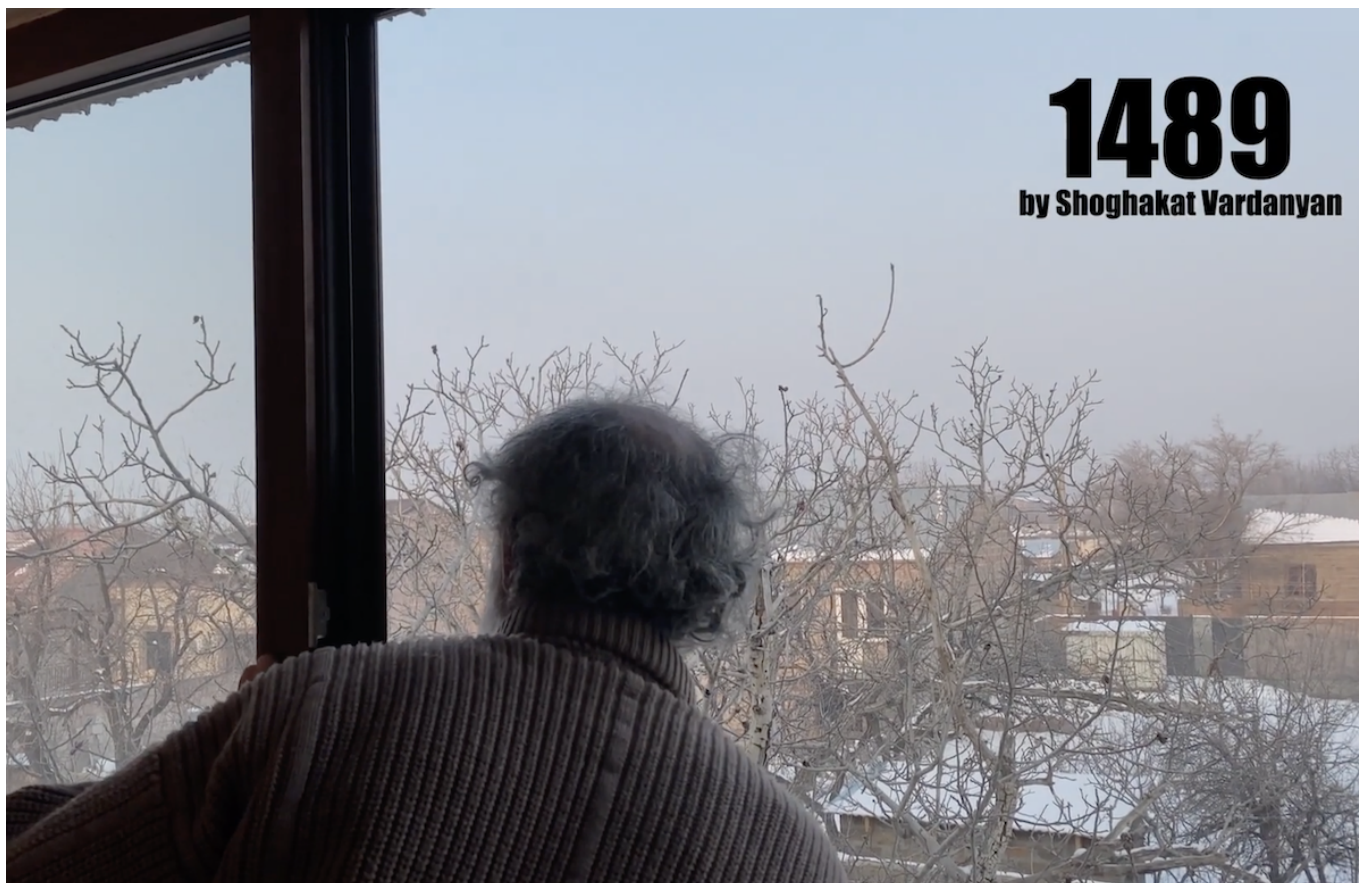
Кадр из фильма «1489»