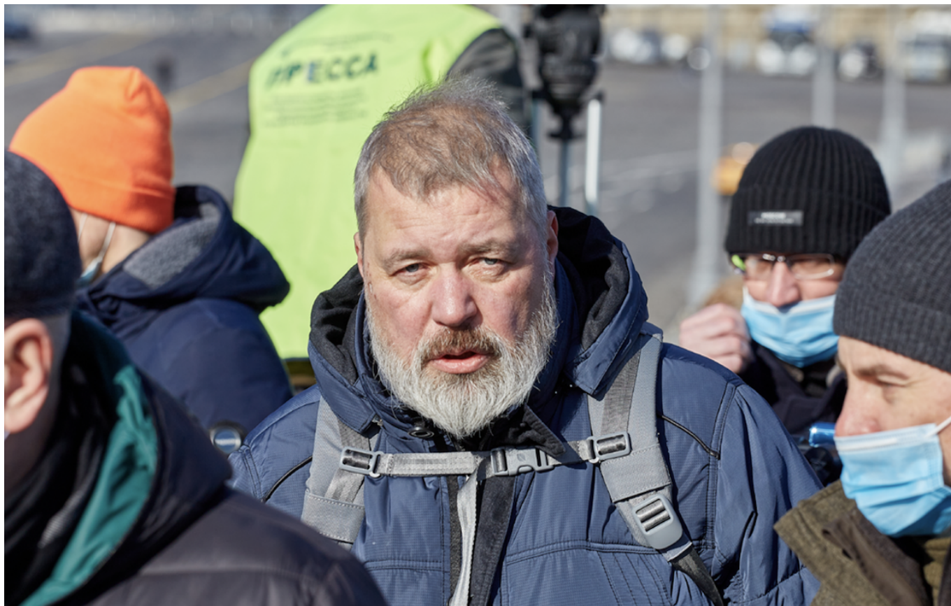
Дмитрий Муратов.