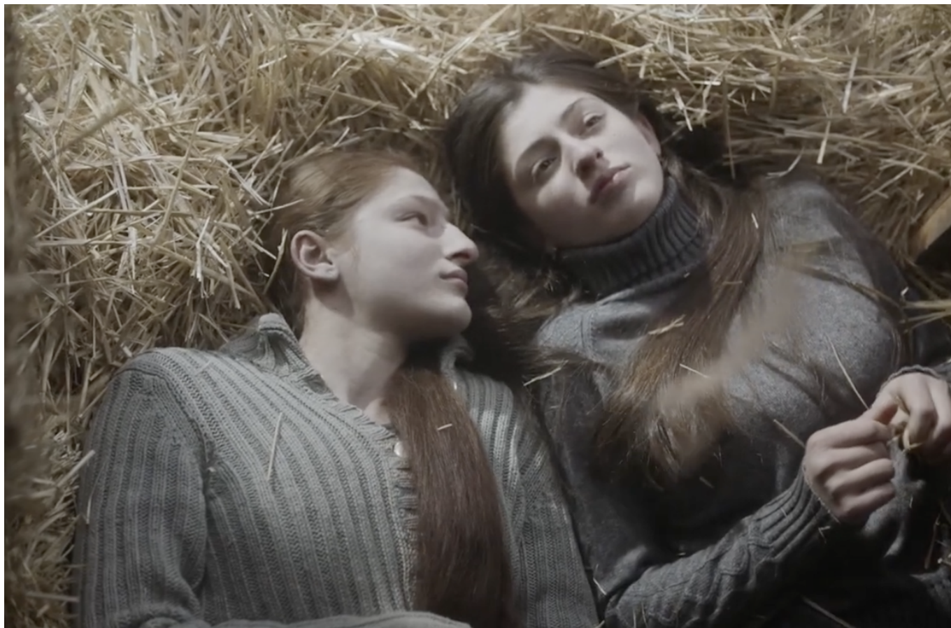
Кадр из фильма «Клетка ищет птицу»

Фильм « В поисках Ники » украинского режиссера Станислава Капралова поднимает тему наших взаимоотношений с животными, которые, как и люди, страдают от войны. Собака режиссера по кличке Ника пропала, когда российские войска вторглись в Украину. Решив найти питомца, Станислав отправился в путешествие по опустошенной войной стране. Он познакомился с волонтерами, которые рискуют всем ради спасения брошенных животных. Его личные поиски превратились в гуманитарную миссию: он принял участие в спасении слепого льва и эвакуации животных, оказавшихся в эпицентре бомбардировок. Картину можно будет посмотреть 10 марта с последующей дискуссией на тему «На пути к этике сосуществования: переосмысление наших отношений с живыми существами», а также 13 марта - после показа состоится обсуждение картины с режиссером (по видеосвязи).