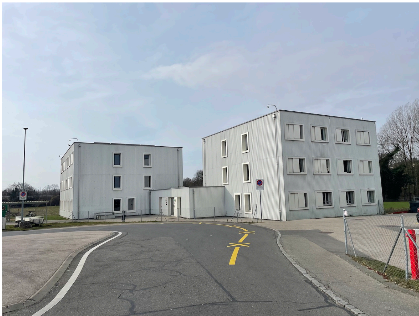
Un des bâtiments d'EVAM, à Ecublens