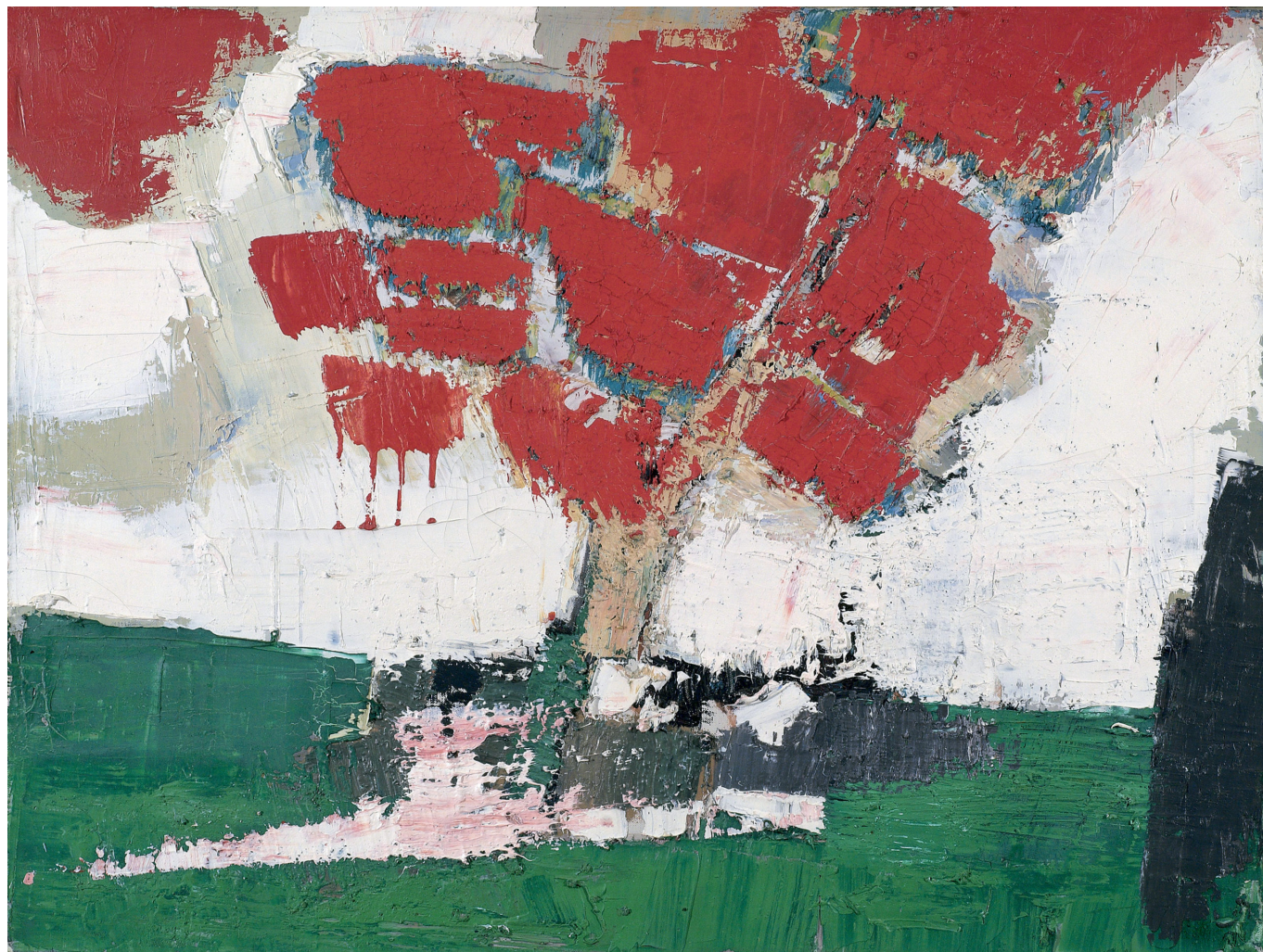
Николя де Сталь. Красное дерево, 1953 г. Collection particulière