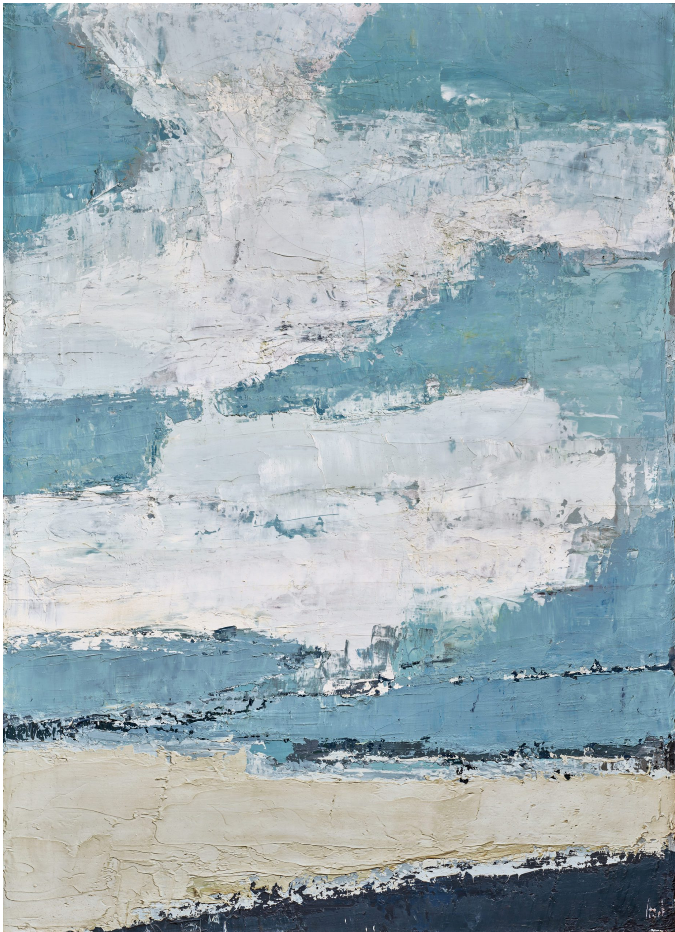
Николя де Сталь. Море и облака, 1953 г. Collection particulière/ courtesy Applicat-Prazan, Paris Photo Thomas Hennocque © 2023, ProLitteris, Zurich