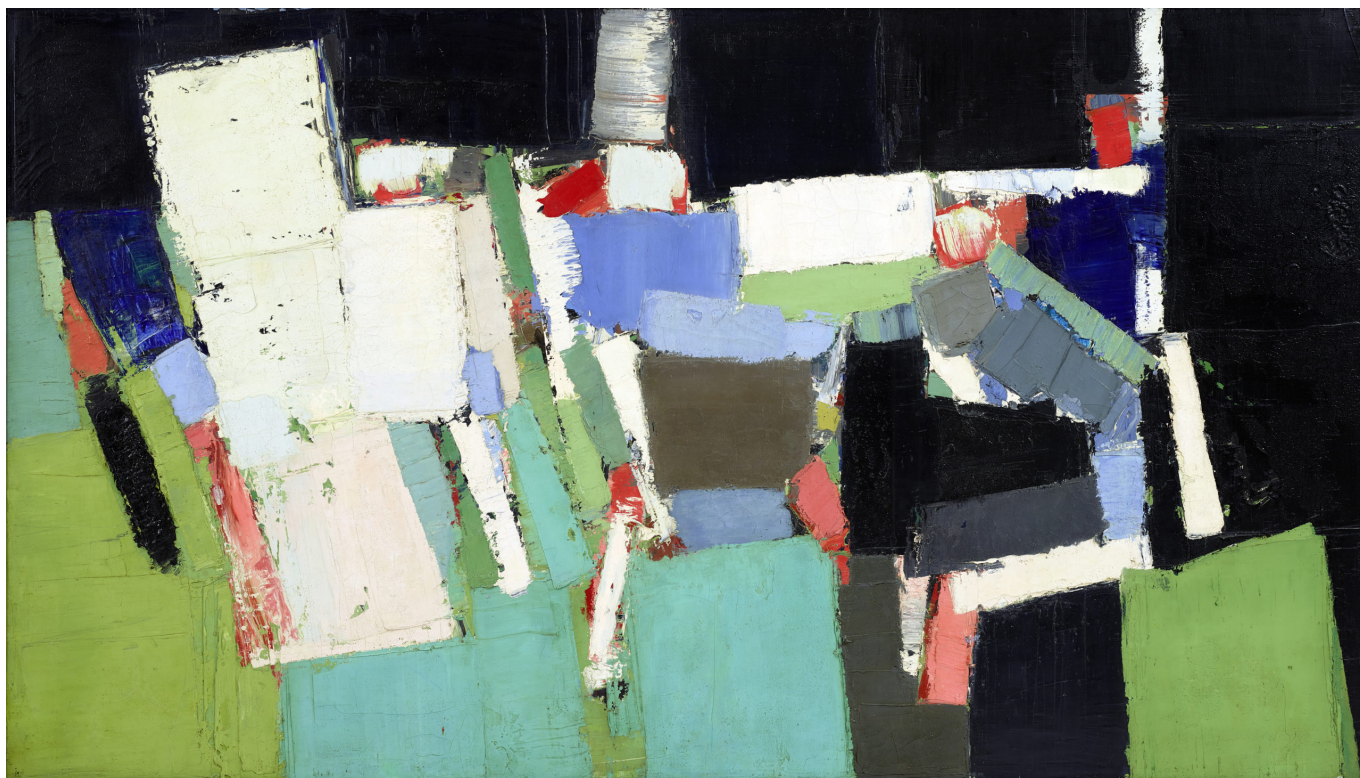
Николя де Сталь. Parc des Princes, 1952 г. Collection particulière