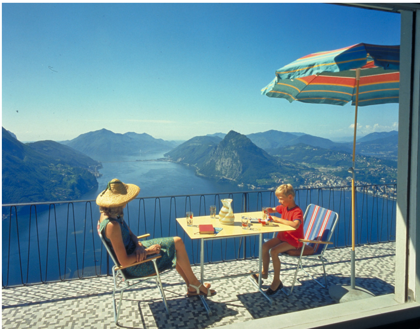
"летней дачи", 1964-1965 гг.