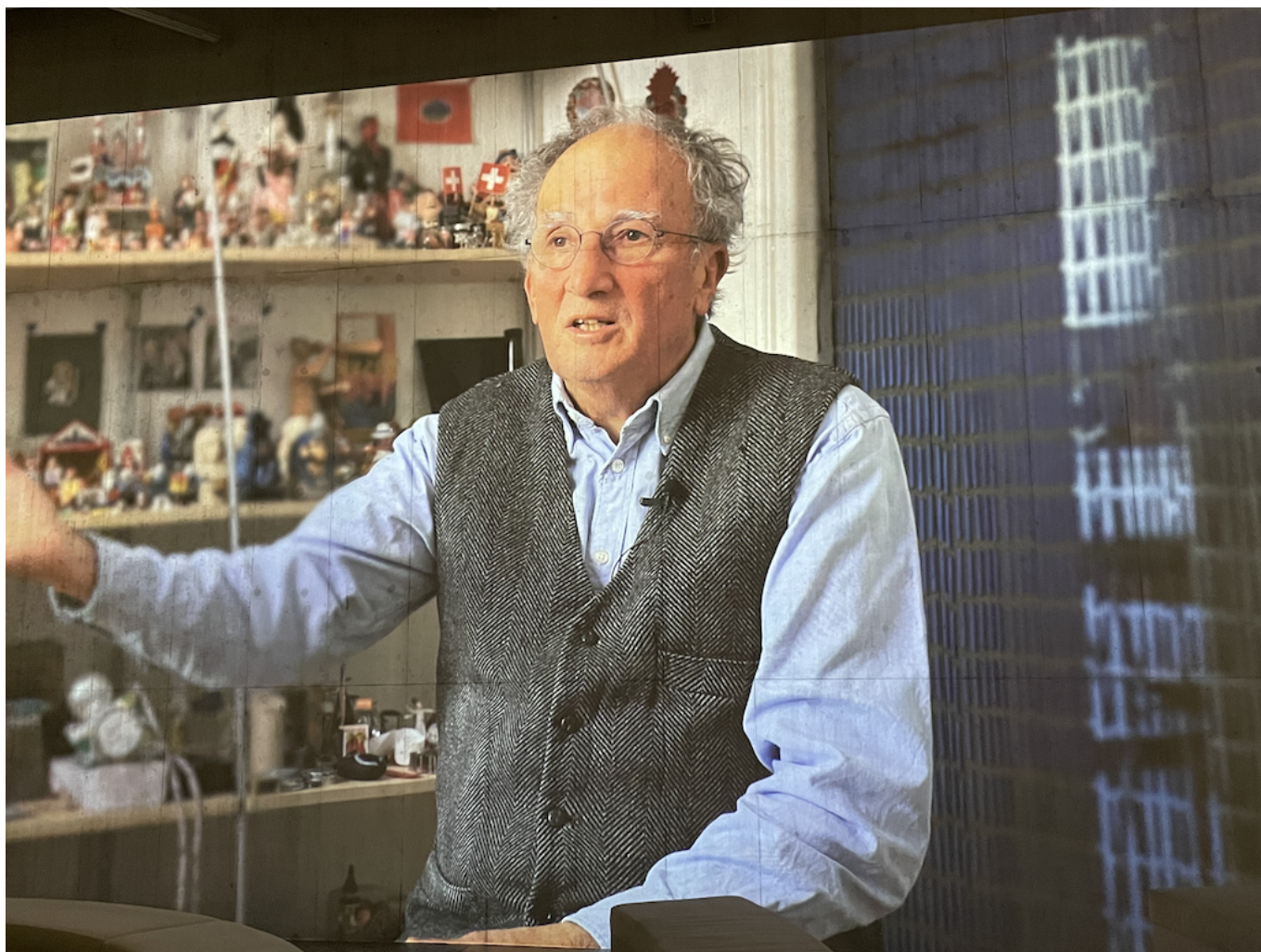
Один из героев выставки