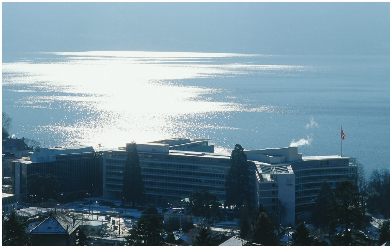
Штаб-квартира Nestlé в Ве́ве (с) Nestlé

Автор: Заррина Салимова, Ве́ве , 05.02.2024.