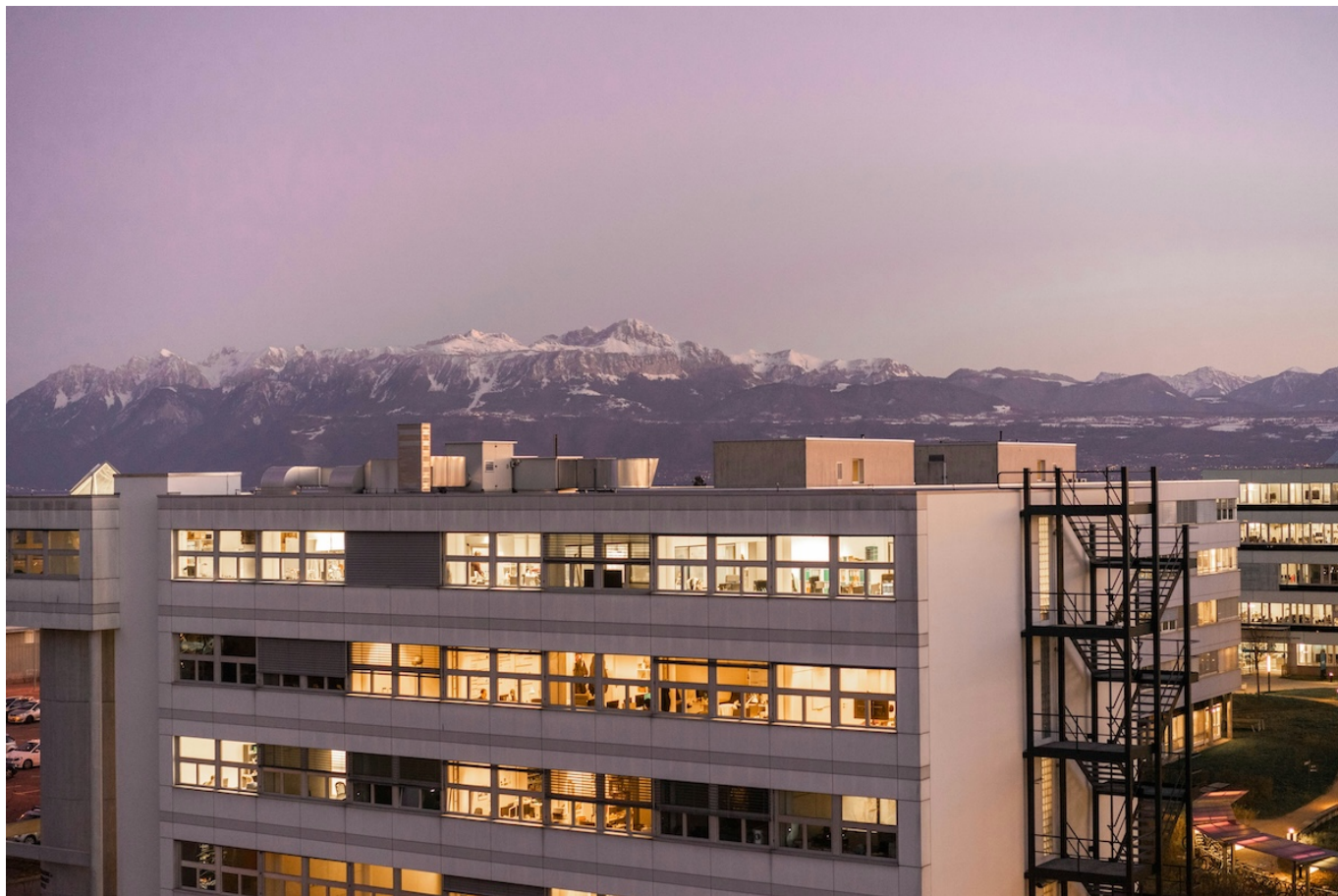
Один из кампусов EPFL.

Автор: Заррина Салимова, Лозанна , 24.01.2024.