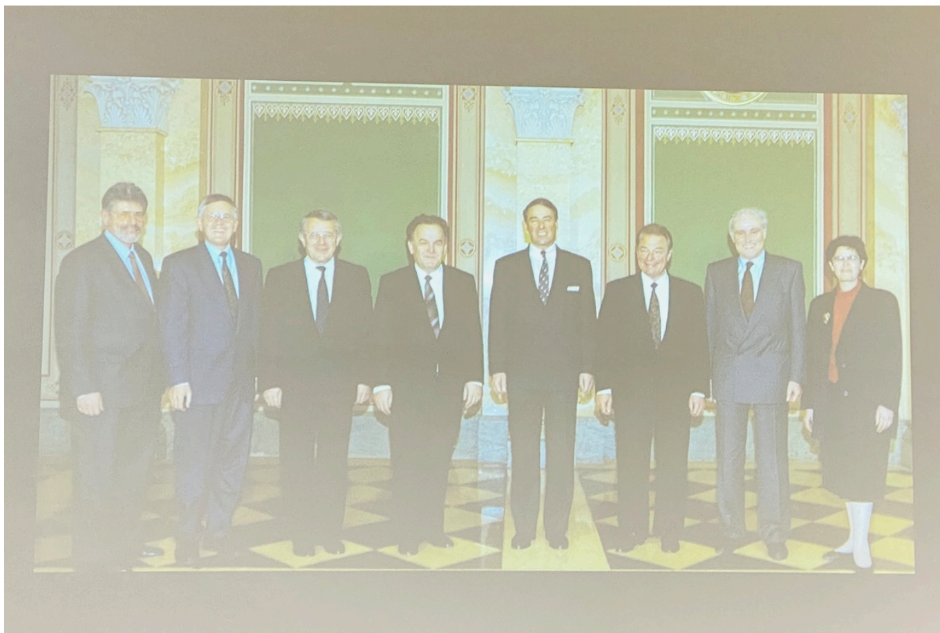
Федеральный совет в 1993 году (презентация Саши Зала, 3 января 2024 г.).

Опубликованные документы свидетельствуют о том, что 30 лет назад Федеральному совету удалось заложить новую основу для отношений между Швейцарией и ЕС. Хотя членство в ЕС оставалось в то время долгосрочной целью для швейцарских властей, наиболее осуществимым и реалистичным казался вариант подписания отдельных двусторонних соглашений. Началась сложная дипломатическая работа: Берну нужно было донести свою позицию до Брюсселя.