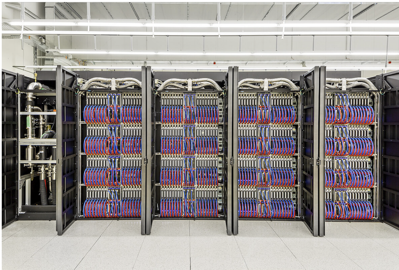
Часть инфраструктуры «Альпы». Фото: CSCS

Автор: Заррина Салимова, Цюрих-Лозанна-Лугано , 08.12.2023.