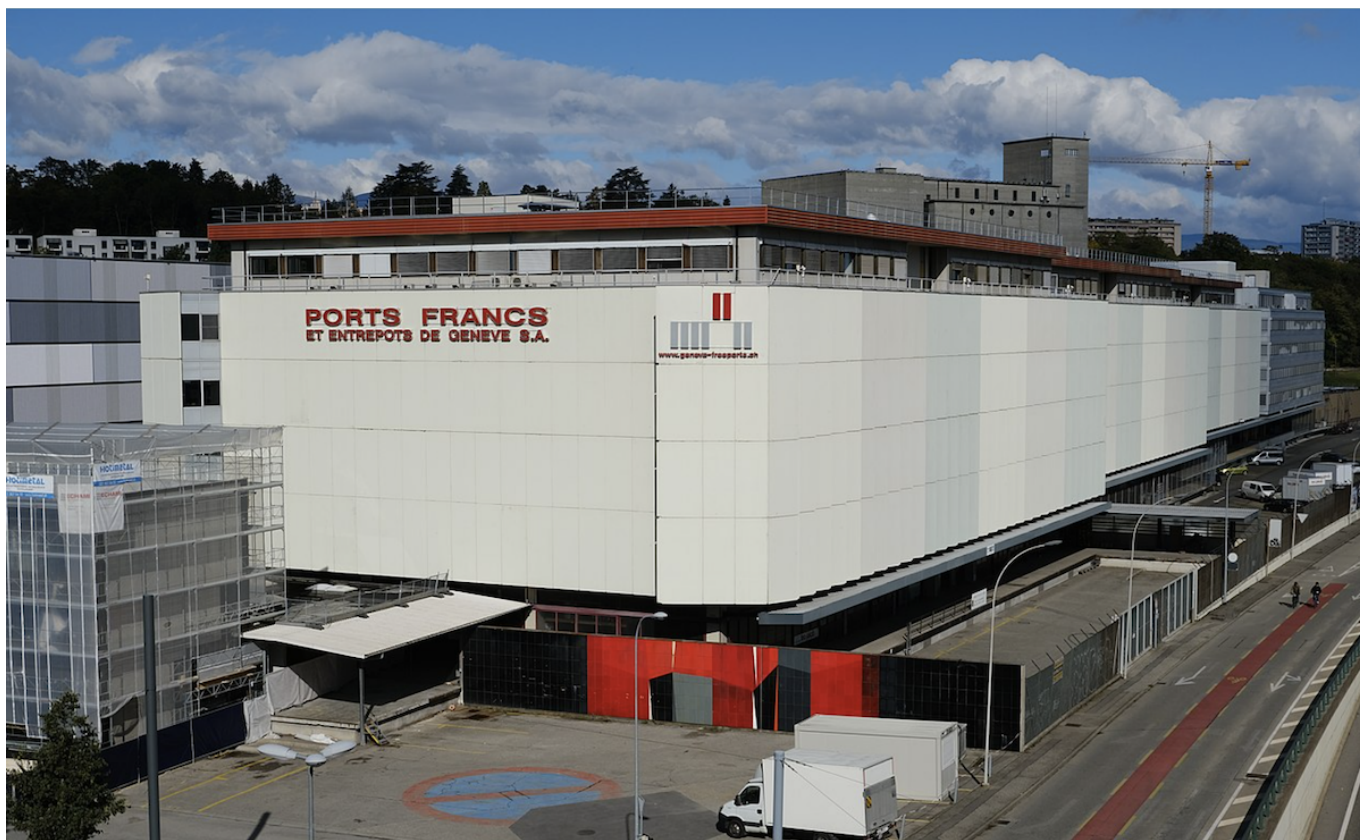
Ports Franks.

Автор: Заррина Салимова, Женева , 24.11.2023.