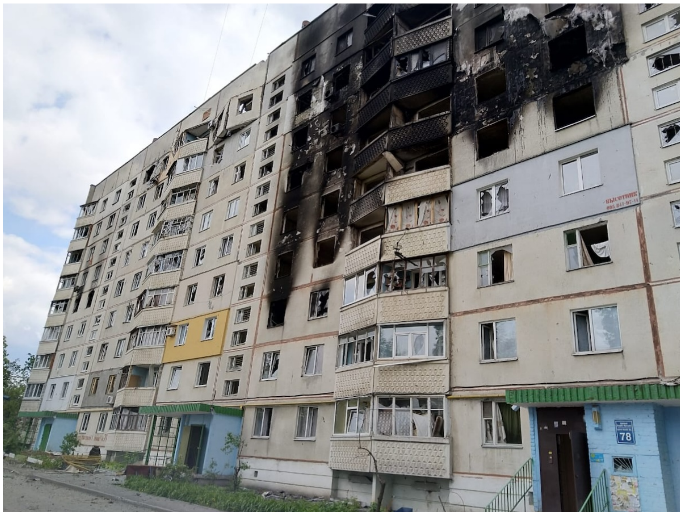
Харьков, март 2023 года.

Автор: Заррина Салимова, Берн , 20.11.2023.