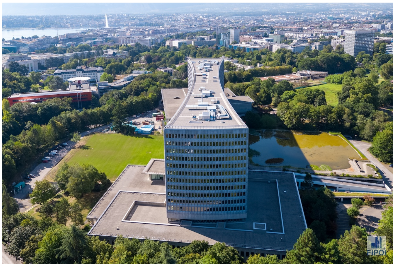
Здание штаб-квартиры MOT в Женеве.