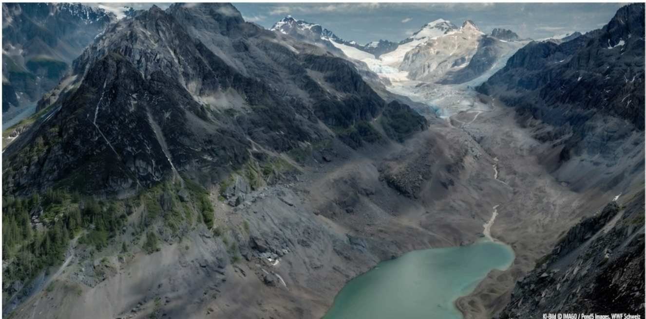
Ледник Алеч

Рейнский водопад, имеющий 23 метра в высоту и 150 метров в ширину, в настоящее время относится к одним из самых больших и полноводных в Европе. Однако в будущем, по оценкам ИИ, водопад пересохнет – от него останутся каменистое дно и небольшие озерца, заросшие водорослями. Нетрудно представить себе размер экономического ущерба, который понесет судоходство на Рейне.