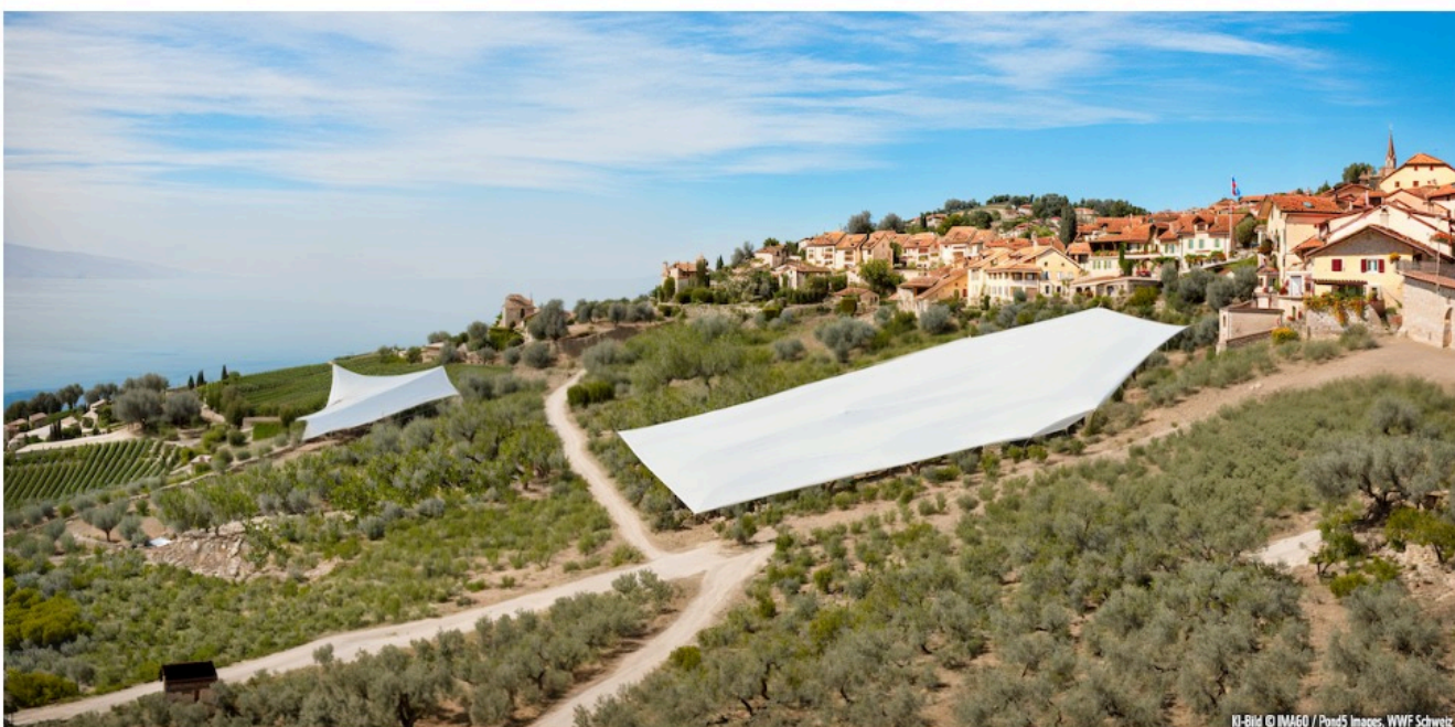
Виноградники Лаво

Акция WWF приурочена к федеральным выборам и призвана привлечь внимание общественности к важности избрания депутатов, заботящихся о защите окружающей среды. В частности, информацию о приверженности партий экологическим вопросам можно получить на сайте ecorating.ch .