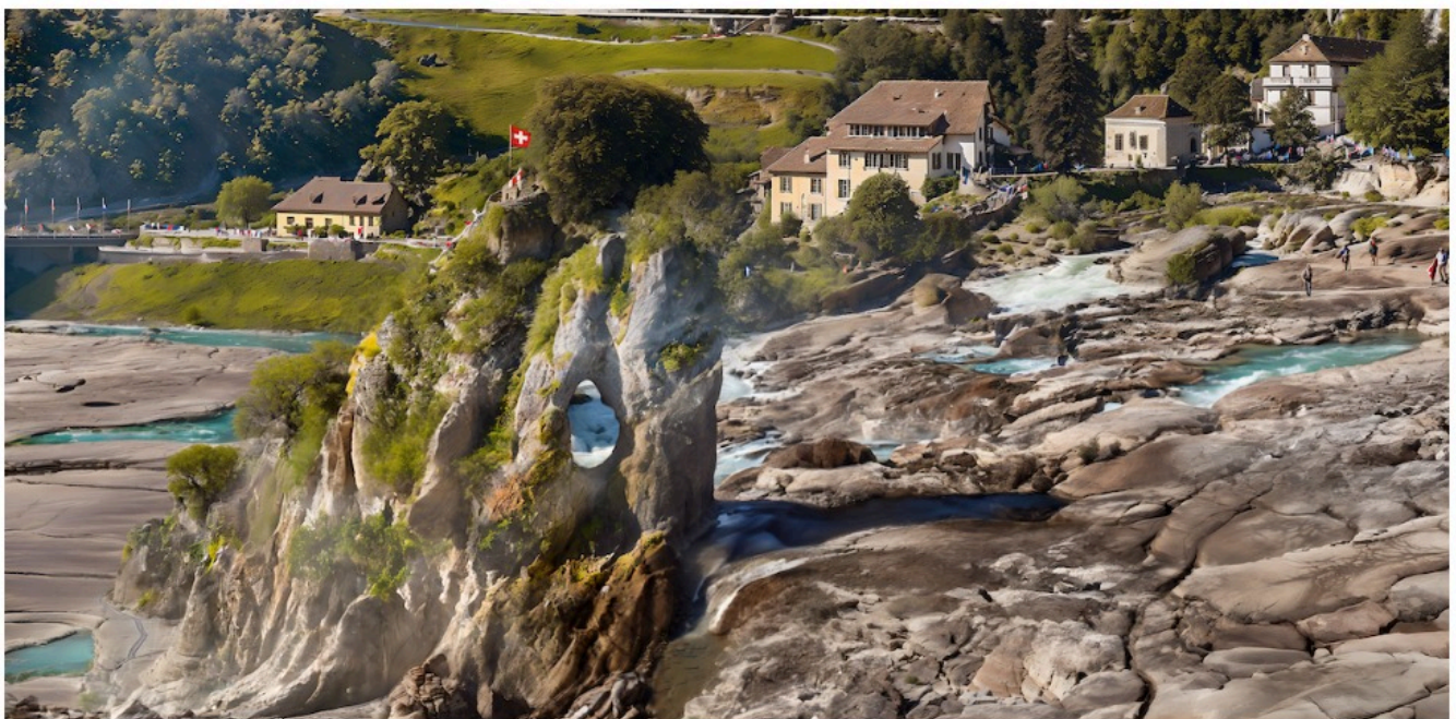
Рейнский водопад

Водуазским виноделам придется адаптироваться к изменению климата, поскольку выращиваемый в настоящее время в Лаво сорт шасла не выдерживает жары. Вместо винограда здесь будут расти оливковые деревья, которые лучше приспособлены к повышению температуры и засухе. Оставшиеся виноградные лозы придется часто орошать и защищать от солнца – это будет стоить дорого, поэтому такое вино будет доступно не каждому.