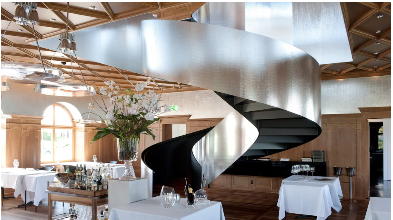
Ресторан «Mammertsberg».

В новом выпуске GaultMillau шесть шеф-поваров набрали 19 баллов: Таня Грандиц («Stucki», Базель), Петер Кногль («Cheval Blanc» в Базеле), Франк Джованнини («Restaurant de l'Hôtel de ville» в Крисье), Андреас Каминада («Schloss Schauenstein» в Фюрстенау), Филипп Шеврие («Domaine de Châteaueux» в Сатиньи) и Хайко Нидер («The Dolder Grand» в Цюрихе). Всех шестерых гастрокритики иронично называют «двойными агентами», потому что они не только выдающиеся шефы, но еще и педагоги, обучающие молодых поваров, которые рано или поздно сами будут блистать на кулинарном олимпе.