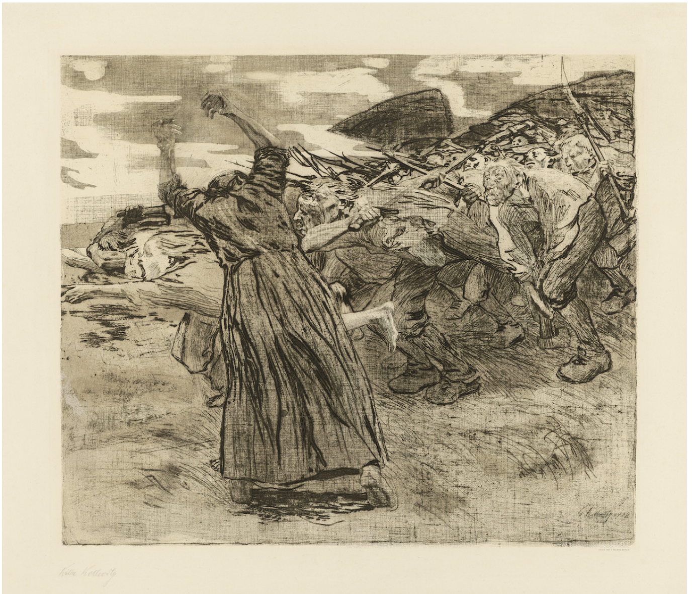
Кете Кольвиц. Крестьянская война, 1902-1903 г.