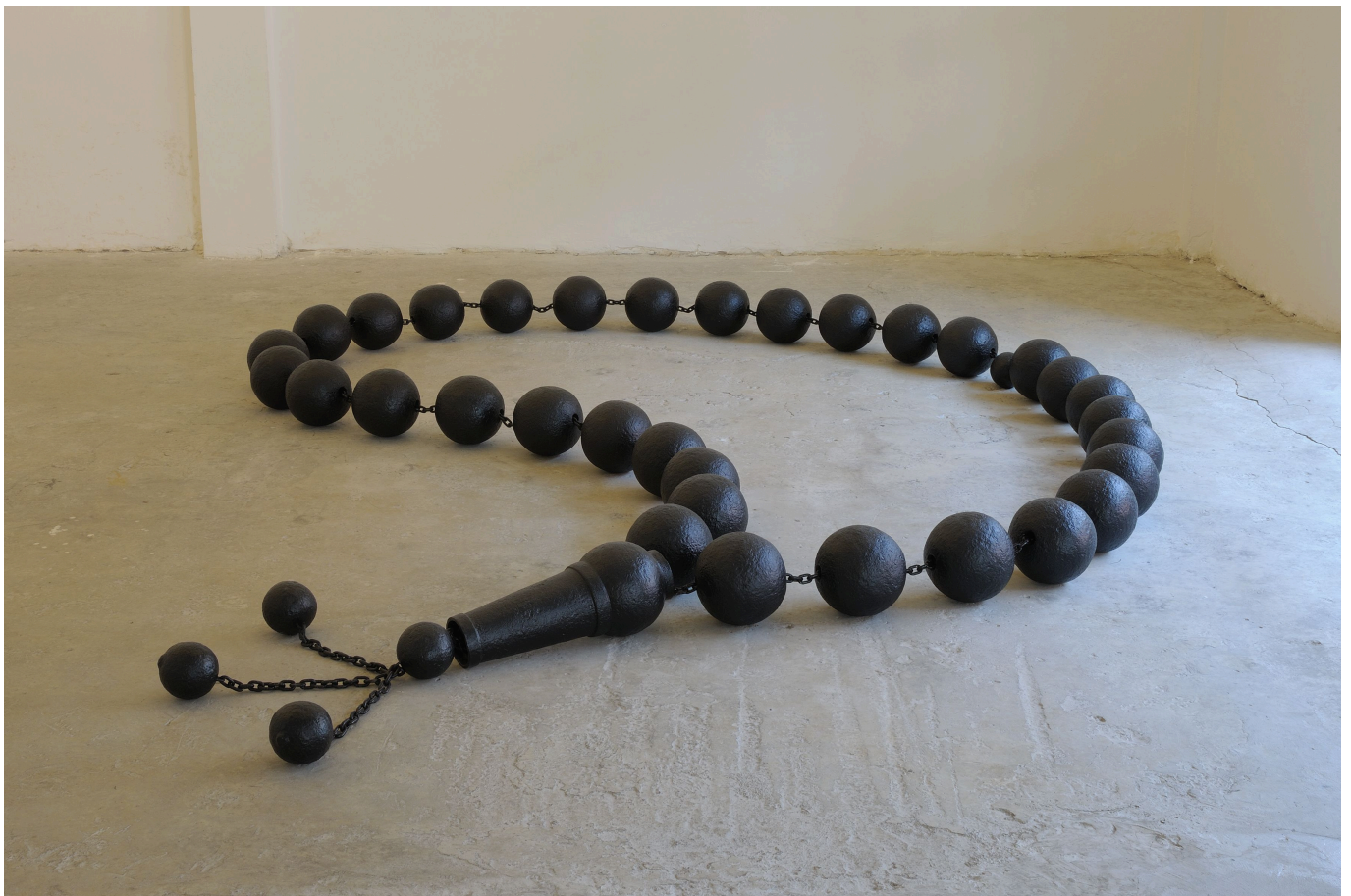
Мона Хатум. Четки беспокойства, 2009 г. Courtesy of Mona Hatoum Foundation © Mona Hatoum Vue d'installation Beirut Art Center, photo: Agop Kanledjian

Разница выразительных средств прекрасно подчеркнута кураторами Йонасом Бейером и Ханнелоре Фишер, которые предусмотрительно «разделили» семьсот квадратных метров выставочного пространства на просторные залы, где оставляющая сильнейшее эмоциональное впечатление черно-белая графика Кольвиц не смешивается с выразительными объектами Хатум, но «дополняется» и как будто подсвечивается ими. Печаль двух этих женщин-художниц, которые говорят о любви, рождении и смерти, удваивается, а то и утраивается от такого соседства, но вместе с тем умножается и свет, который излучают даже самые мрачные их работы. Взвешенные, немногословные комментарии, которые сопровождают совместную с Кунстхалле Билифельда и кельнским музеем Кете Кольвиц экспозицию, помогают сосредоточиться на главном, создавая тот самый контекст, которого так не хватало в закрытых сейчас залах Бюрле. Более того, разделение личной и творческой биографии Кольвиц на главы («Автопортреты», «Революция», «Любовные сцены») помогает не только лучше сориентироваться в пространстве, но и двигаться поступательно, от социального к личному и метафоричному.