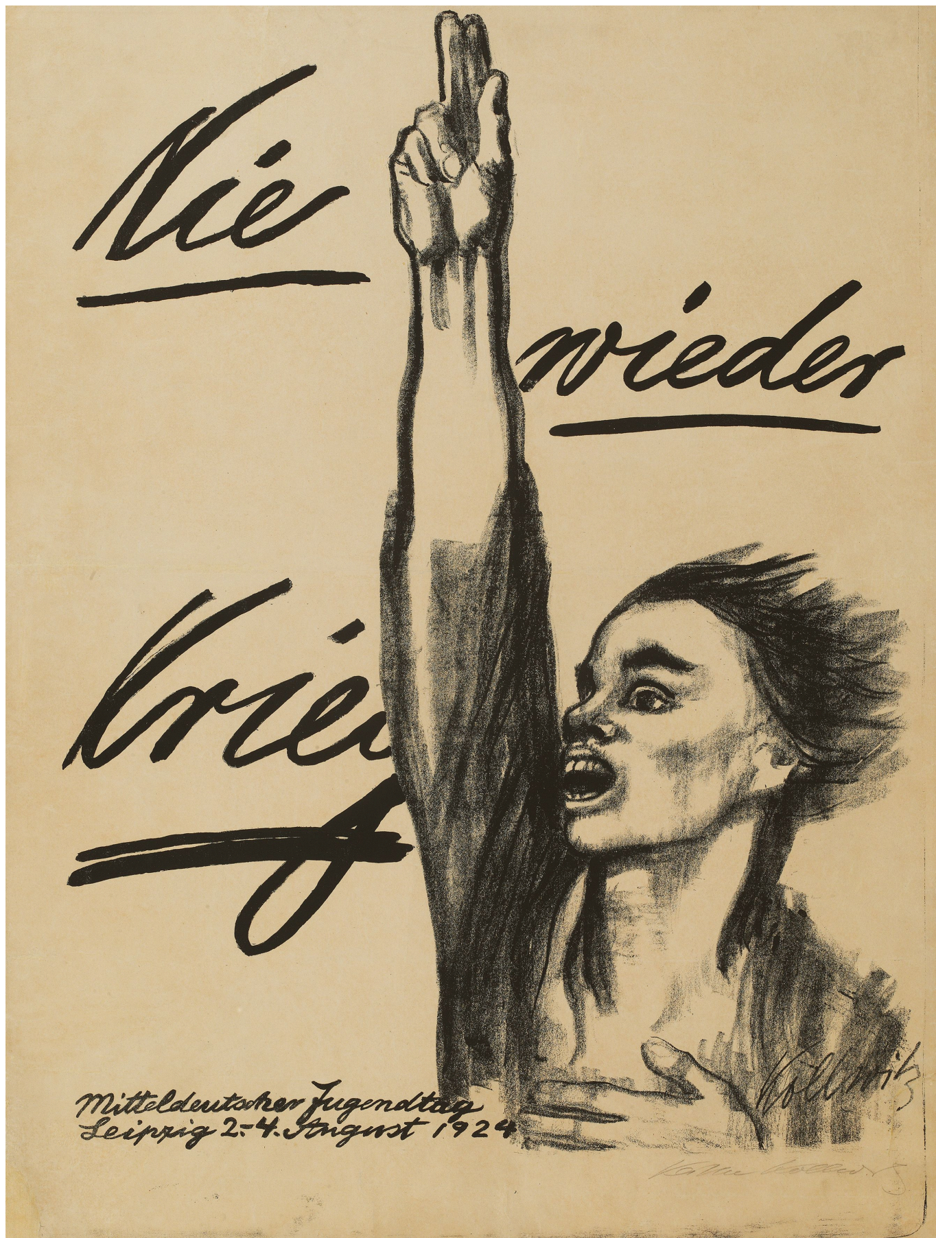
Кете Кольвиц. "Нет войне!"

Лауреат премии Кете Кольвиц, палестинка Мона Хатум – наша современница. Она родилась в 1952 году в Бейруте, в юности уехала в Лондон и была вынуждена там остаться, так как в 1975 году в Ливане началась Гражданская война. С тех пор она