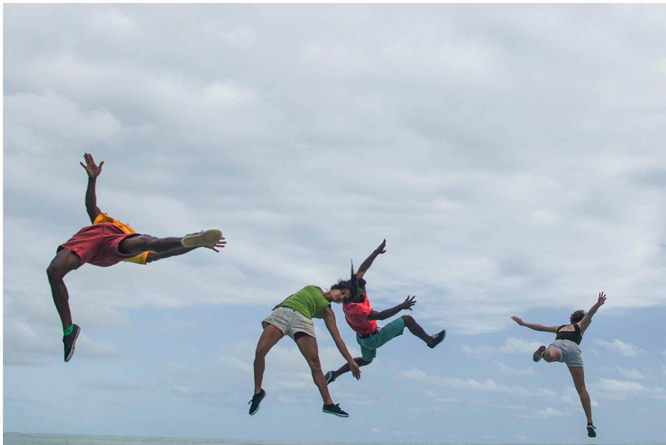
Одно из многочисленных уличных представлений

труппа Dançando com a Diferença – на сей раз артисты с ментальной инвалидностью покажут спектакль под названием «Ôss» в постановке знаменитого хореографа Марлин Монтейро Фрейтас (17-19 августа, сцена NORD). Среди любопытных танцевальных спектаклей следует также отметить «Hmadcha» марокканца Тауфика Изеддиу (28-30 августа, площадка SEEBÜHNE), где девять танцовщиков-мужчин буквально сливаются в единой ритмической медитации.