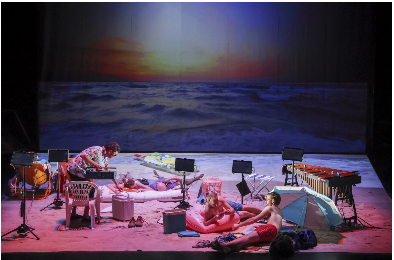
Сцена из спектакля Хельгард Хаук "Rimini Protokoll"

В этом году, помимо доступности, среди целей фестиваля заявлены разнообразие, сотрудничество и устойчивость. Как следствие, в программе сделан акцент на инклюзию и отсутствие дискриминации по любому признаку, а в фестивальной городке – на удобство и наличие места, в том числе и для уединения, для каждого. Более того, в этом году на Theater Spektakel будет работать специальная Awareness Team, к сотрудникам которой можно обратиться в случае проявления недоброжелательности или нарушения личных границ со стороны гостей или участников фестиваля. Безусловно, все эти шаги дирекции показывают, насколько человечным и современным хочет быть главный швейцарский театральный фестиваль, но все-таки самой главной его составляющей, тем, за чем люди приезжают на Landiwiese, остается собственно программа.