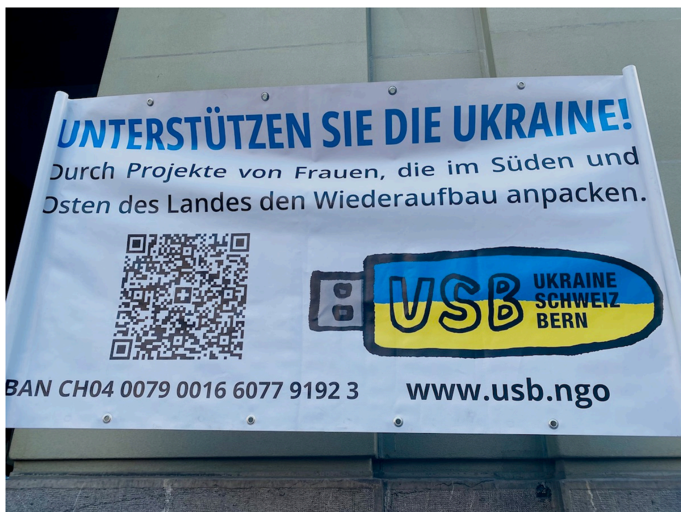
Транспарант ассоциации «Украина-Швейцария-Берн».

Наше особое внимание привлек транспарант ассоциации «Украина-Швейцария-Берн» , которая собирает средства на социальные и гуманитарные проекты в Украине, например, помогая семьям с детьми, пострадавшим от разрушений и живущим в подземных убежищах. Как пояснили волонтеры, ассоциация также организует курсы, мастерские, профессиональные консультации, творческие и коррекционные занятия для украинских беженцев всех возрастов – детей, подростков и взрослых. Учитывая тот факт, что абсолютное большинство украинских беженцев в Швейцарии составляют женщины и дети, участие подобных ассоциаций в национальной женской забастовке более чем оправдано.