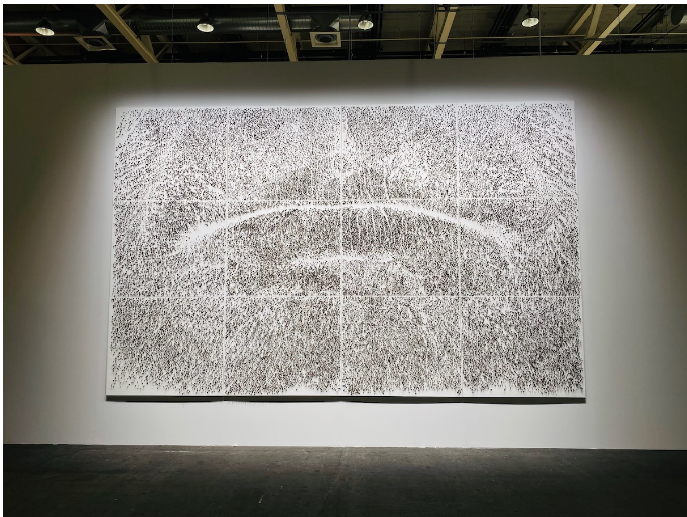
Spine d'acacia—Contatto, aprile 2006, 2006 Giuseppe Penone.

«Наследственные раны» Хэ Сянью, на наш взгляд, можно назвать одной из самых интересных инсталляций. 24 стула, найденные художником в разных школах, испещрены каракулями и царапинами, оставленными школьниками, которые таким способом сопротивлялись «гомогенизации». Стулья аккуратно расставлены по трем диагональным линиям, создавая ощущение строгого порядка. Перед ними стоит группа миниатюрных стульев, которые являются точной копией оригинала и имеют те же повреждения. Эти копии, таким образом, «унаследовали» травму, спровоцированную подавлением и ограничением индивидуальности. Два комплекта идентичных школьных стульев заставляют задуматься о неизбежности передачи травм от одного поколения другому.