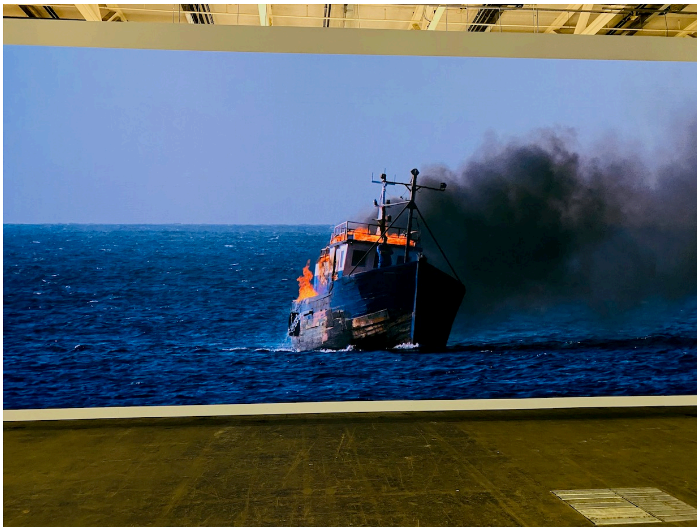
Jam Proximus Ardet, la dernière vidéo, 2021 Adel Abdessemed.

Что, помимо навигационной тематики, объединяет эти работы? Плакативность, которую в общем и целом можно назвать бедой этого выпуска. Экология, миграция, деколонизация – галочки расставлены везде. Когда идет война, когда мы переживаем неопределенные времена в геополитическом и финансовом планах, когда мы испытываем страх, неуверенность и постоянное беспокойство, мы хотим обратиться к искусству за утешением и ответами. Прошлогодня биеннале в Венеции, например, была проникнута ощущением острой тоски, став достоверным отражением текущей мировой ситуации, но при этом посетители покидали выставочные павильоны с ощущением веры в будущее человечества. На Art Basel чувства и эмоции вытесняются бесконечными разговорами о продажах и перспективах развития арт-рынка. Безусловно, Art Basel – это ярмарка, а не биеннале или музейная выставка, поэтому и ожидания должны быть другими. Тем не менее, немного грустно осознавать, что коммерческая составляющая этого мероприятия постепенно затмевает все остальное.