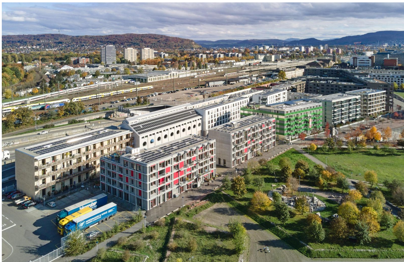
Erlenmatt Ost Photo © Stiftung Habitat

Автор: Леонид Слонимский, Базель , 26.05.2023.