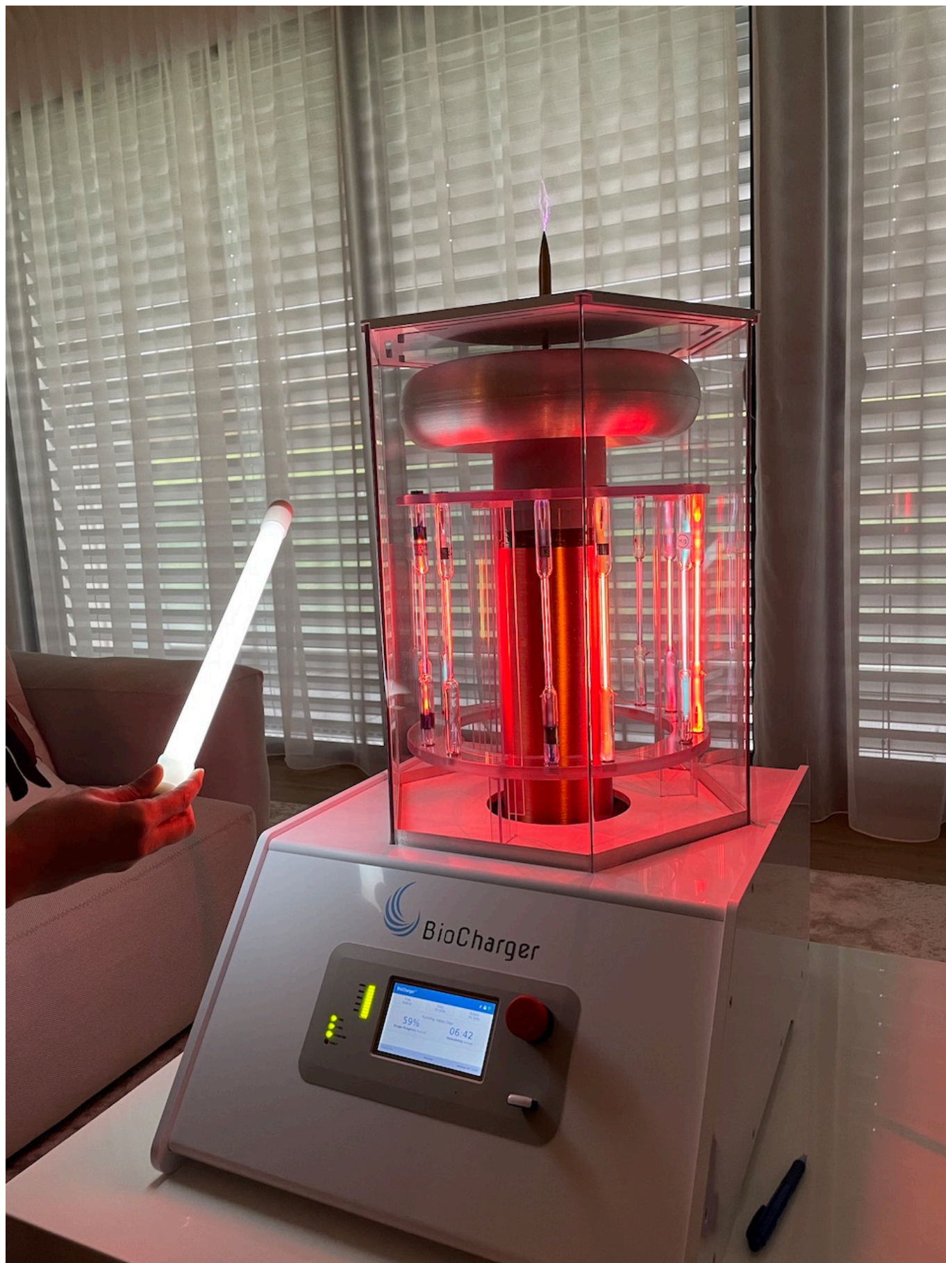
Так выглядит BioCharger

Одним из сильнейших впечатлений от дня, проведенного в клинике Nescens, стал сеанс криптотерапии, то есть лечения экстремальным холодом, позволяющим активизировать внутренние резервы организма. Если бы кто-то сказал автору этих