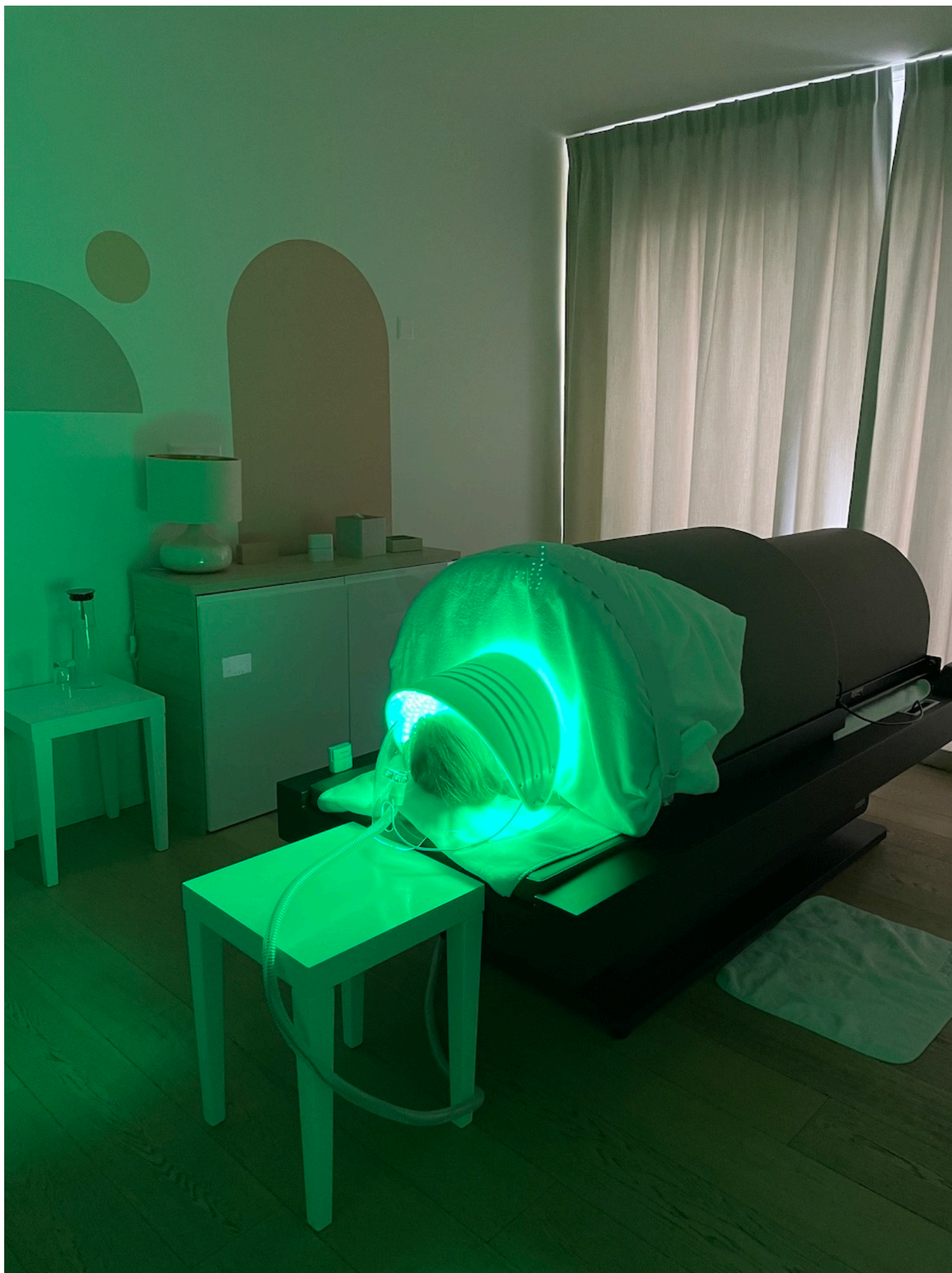
Заточение в Dôme Infrarouge

Аппарат BioCharger®, поджидавший нас в следующем процедурном кабинете, мы увидели впервые, что не удивительно, ведь клиника Nescens – единственная в Швейцарии, которая им обладает. Первая ассоциация с ним – приспособление для