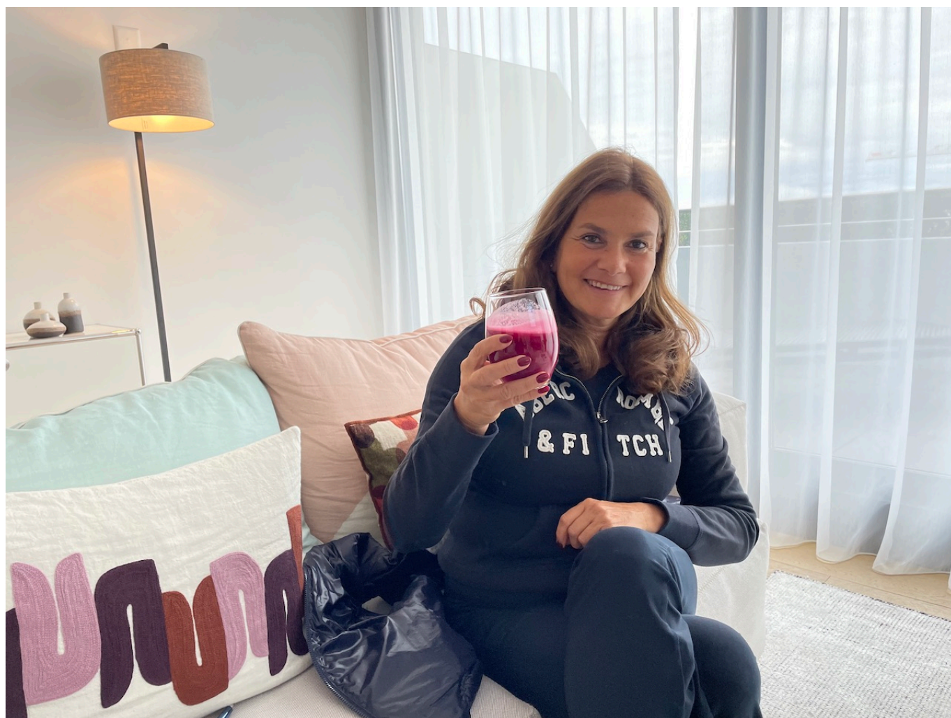
Коктейль оздоровительно-бодрящий. Красный

Последний наш эксперимент касается самого главного достояния каждого из нас – здоровья. Постоянные читатели знают, что все достижения швейцарской медицины находятся в поле наше зрения, как и все изменения в системе здравоохранения. Помимо конкретных событий, мы неустанно обращаем ваше внимание на то, что ключ к укреплению здоровья и отдалению наступления старости на максимально долгий срок – в изменении самого образа жизни, в отказе от вредных привычек и приобретении новых, полезных. «Надо меньше нервничать!», советуют все врачи. И мы вместе с вами пожимаем плечами: как же не нервничать, когда вокруг такое творится! Однако необходимо выкраивать для себя оазисы отключения от проблем просто для того, чтобы хватило сил с ними справиться.