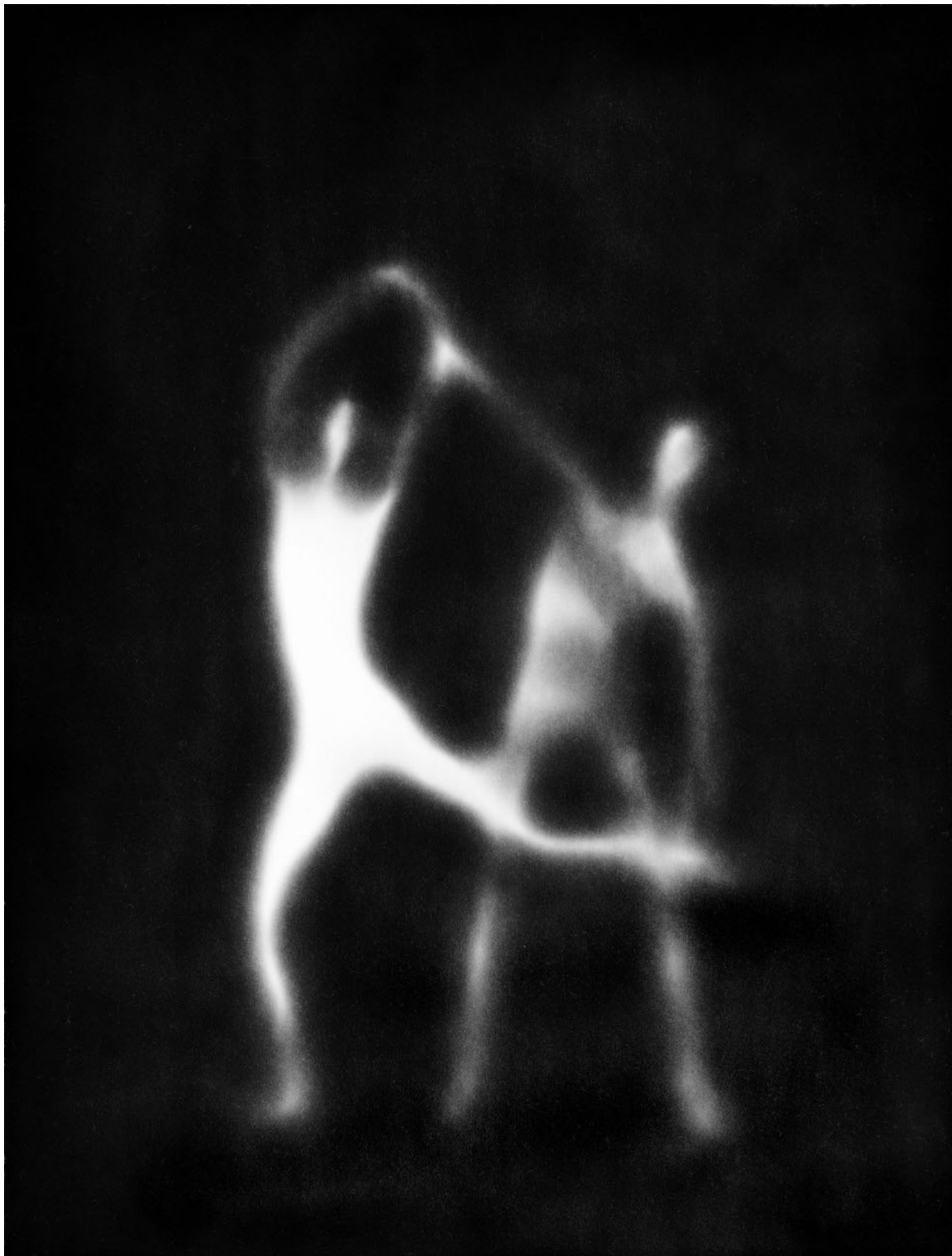
Йозеф Куделька. "Чехословакия", 1962 г.

Как это порой бывает, дальнейшую жизнь и карьеру Йозефа Куделки определили внешние обстоятельства. В 1968 году он стал свидетелем вторжения советских войск