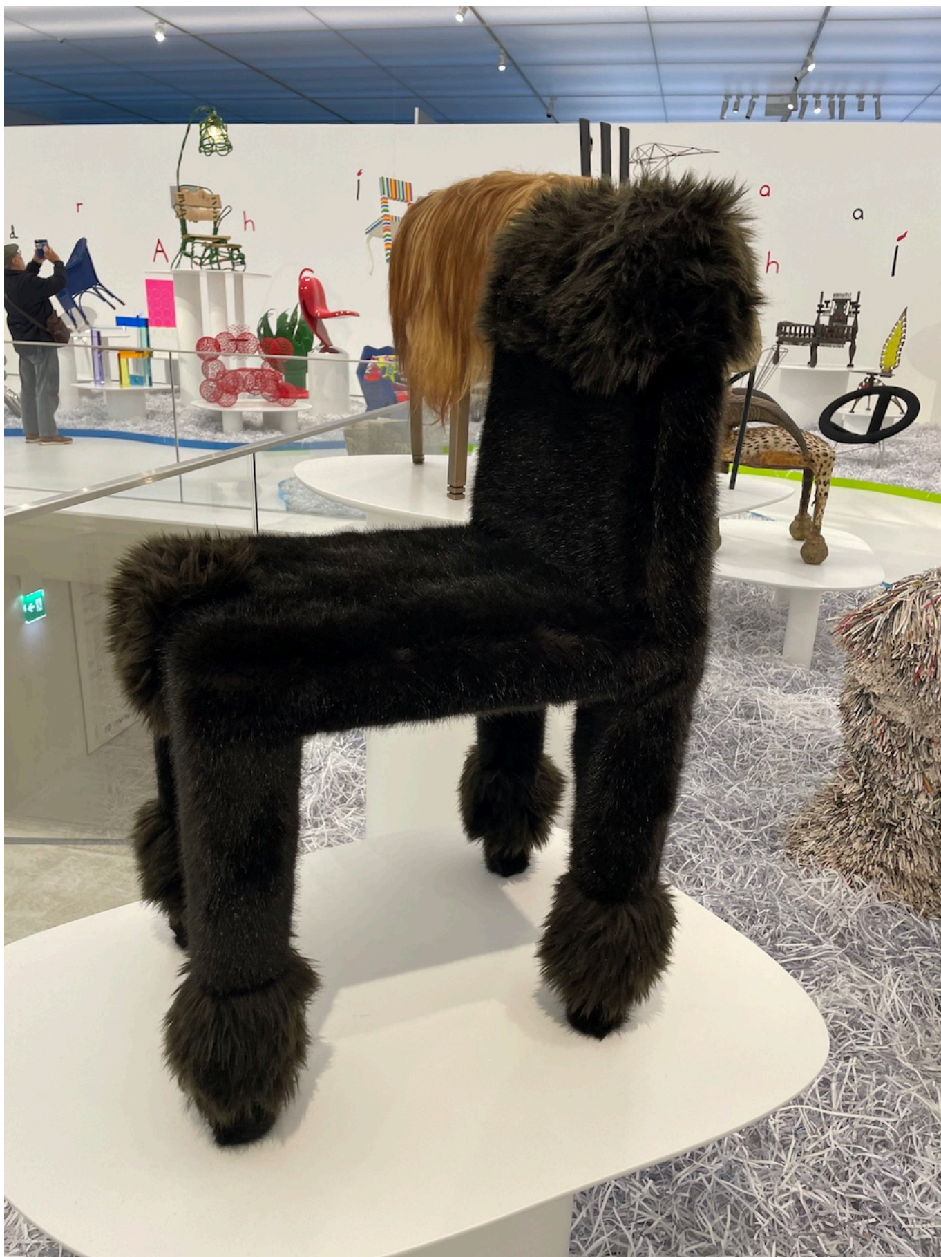
Ван Эйк и Ван Люббе. Стул-пудель, 2002 г.

Конечно, есть среди экспонатов настоящие троны, так и приглашающие усесться на них, предварительно водрузив на голову корону. Есть такие, на которых впору развалиться, словно на кушетке, прихватив хорошую книгу. Но есть и те, на которые