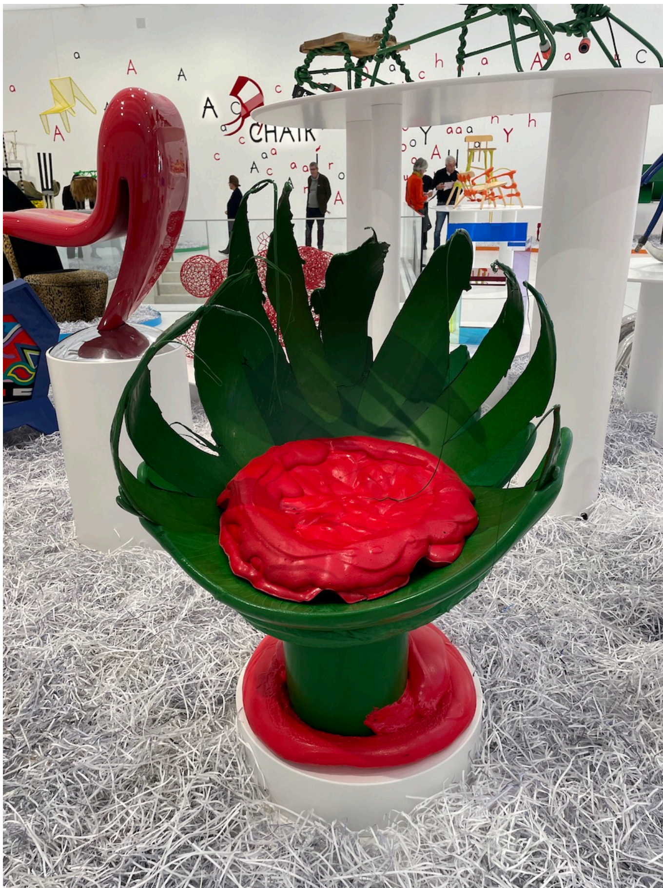
Стул "Хищное растение", Луи Дюро, 1979 г. Единственный экземпляр

Но начнем с начала, то есть с владельца уникальной коллекции. Тьерри Барбье-Мюллер известен одним как глава женевского агентства по недвижимости SPG,