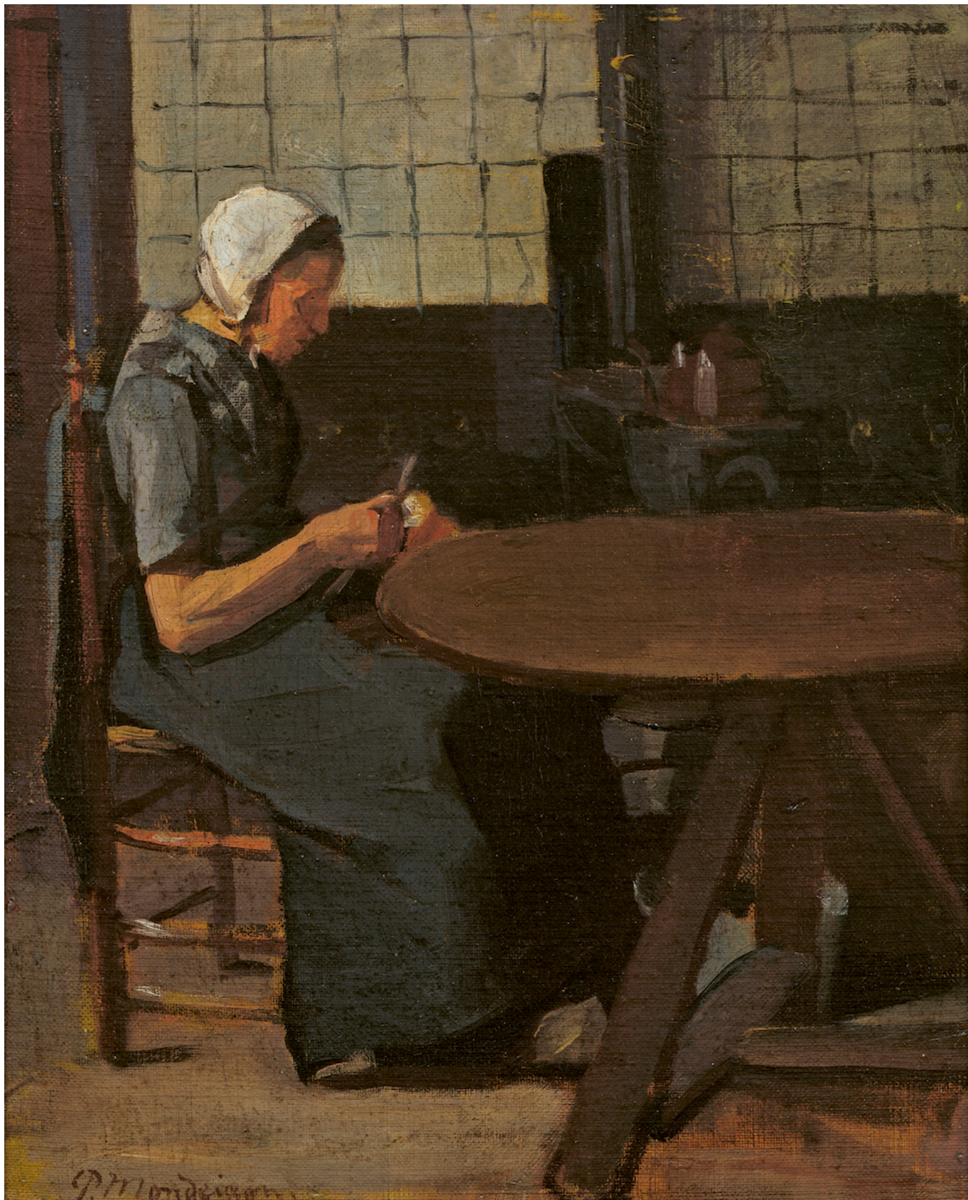
Пит Мондриан. Женщина с веретеном, ок. 1893-1896 гг. Предоставлено галереей Pace. © 2022 Mondrian/Holtzman Trust.

В начале 1910-х годов Мондриан увлекся цветом. На его полотне «Красное облако» 1907 года запечатлен волшебный момент, когда заходящее солнце окрашивает облако в ярко-красный цвет, в то время как небо остается ярко-синим. Эта картина принадлежит к группе работ, которые Мондриан писал в сумерках, когда оттенки быстро меняются. На автопортретах 1908 года он также изображает себя в сумерках