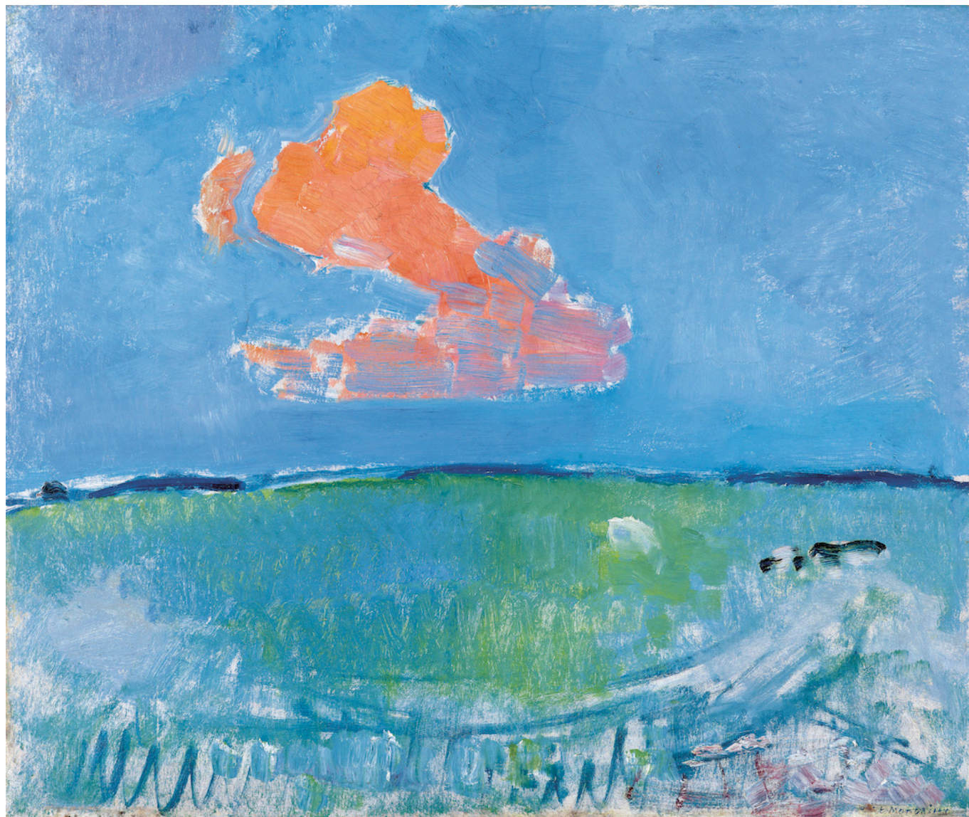
Пит Мондриан. Красное облако, 1907 г. Гаагский музей искусств, Нидерланды © 2022 Mondrian/Holtzman Trust. Фото: Musée d'Art de La Haye

После цветовых экспериментов 1907-1911 годов Мондриан, вдохновленный знакомством с кубистами в Париже, вернулся к менее ярким цветам. В его картинах этого периода преобладают серые и охристые тона, а линии приобретают все большее значение.