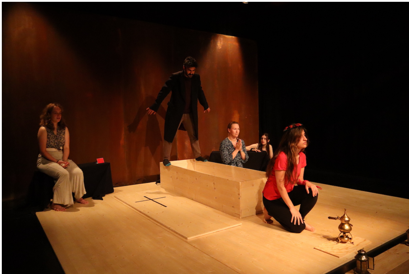
Репетиции «Антихриста» в Санкт-Галлене