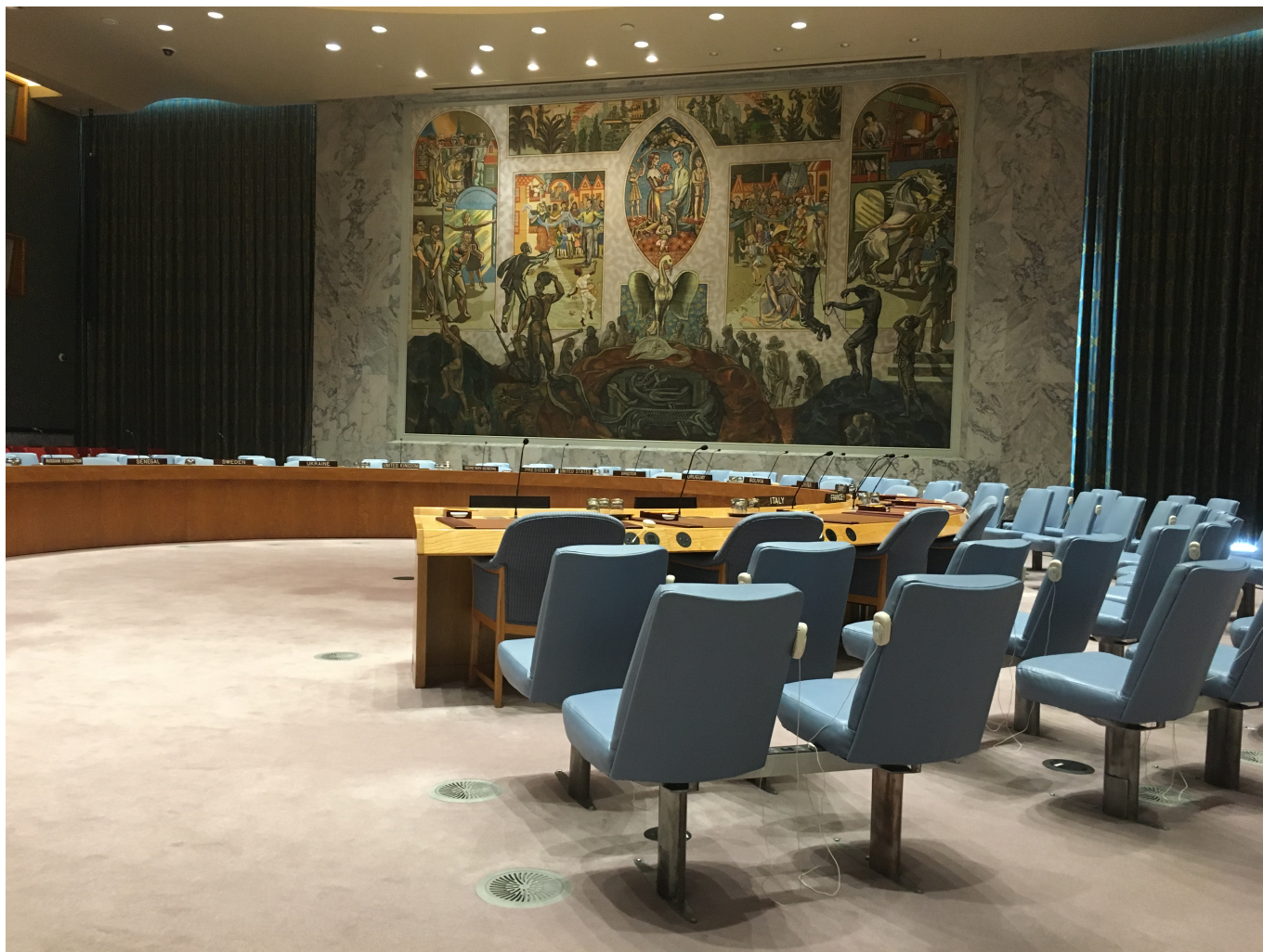
Зал заседаний Совета Безопасности ООН в Нью-Йорке

Автор: Надежда Сикорская, Берн , 10.06.2022.